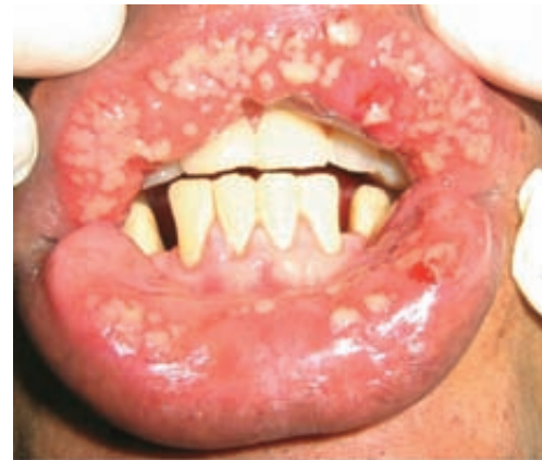
Figura 2. Úlceras en mucosa labial.