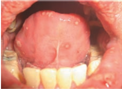
Figura 4. Ulceras en cara dorsal y ventral de lengua.