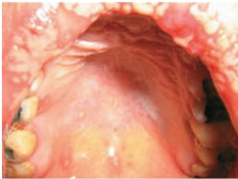
Figura 5. Ulceras en paladar duro y blando.

Se procede a realizar la maniobra semiotécnica de la prueba de Nicolsky en carrillo izquierdo, (Figura 6) para lo que se utilizó una cánula de succión, que ocasionaría la formación de una ampolla en caso de estar en presencia de un pénfigo, esta prueba resultó negativa. 27,28