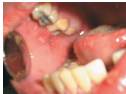
Figura 3. Úlceras en mucosa yugal.