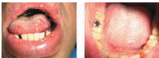
Figura 11. La primera foto corresponde a la cara dorsal de lengua cuando ingreso, la segunda a la cara dorsal de lengua después de 20 días de tratamiento.