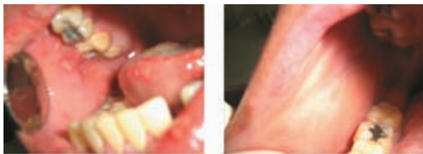
Figura 10. La primera foto corresponde a la mucosa yugal cuando ingreso, la segunda a la mucosa yugal después de 20 días de tratamiento.