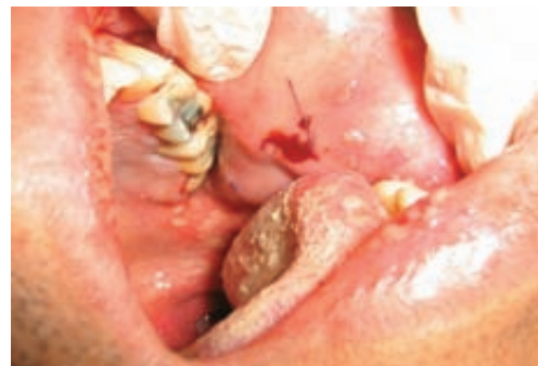
Figura 7. Incisión elíptica en mucosa yugal izquierda (muestra para biopsia) y sutura de la mucosa yugal con puntos simples