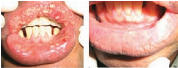
Figura 9. La primera foto corresponde a la mucosa labial cuando ingreso, la segunda a la mucosa labial después de 20 días de tratamiento.

En la cita de control después de 20 días de aplicado el tratamiento el paciente muestra notorias mejorías (Figura 9, 10, 11).