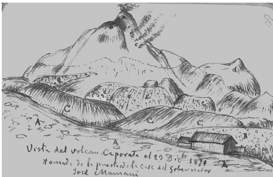
Ilustración del área de Guallatire frente al volcán Pedro Capurata en la cual aparecen algunos apuntes, donde se menciona al gobernador José Mamani, el mismo que en 1862 había electo síndico suplente de Guallatire.