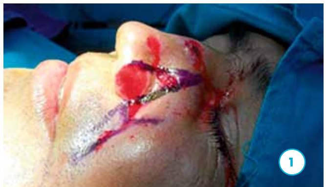
Imagen 1. Se aprecia la demarcación de las incisiones respectivas.