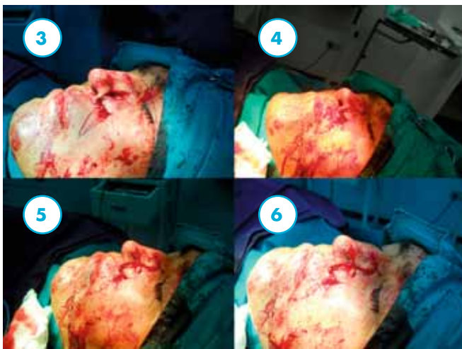
Las imágenes 3, 4, 5 y 6.

Se puede apreciar, las incisiones ya realizadas y la elevación del colgajo, previa extirpación del tejido excedente.