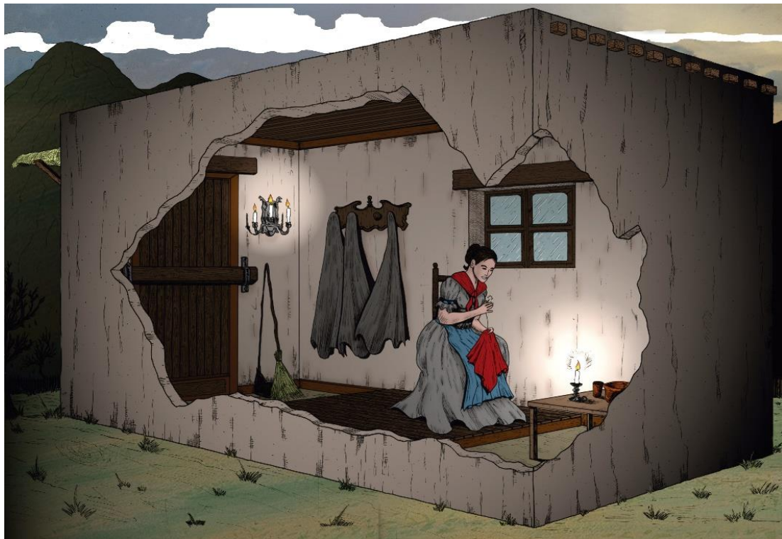
Autor: Mgter. Martín Alejandro Salinas - FCH-UNSL