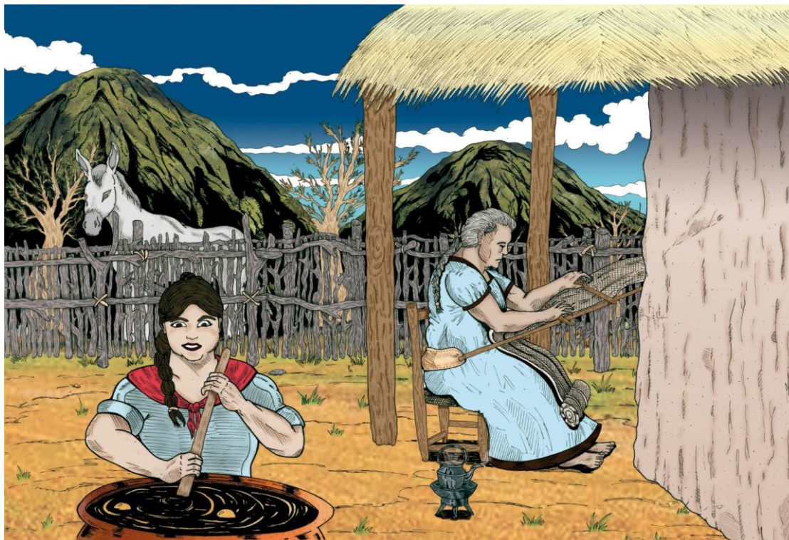
Imagen 4. El trabajo de las mujeres

Autor: Mgter. Martín Alejandro Salinas - FCH-UNSL