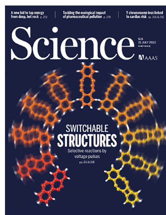
Portada de la revista que publica el trabajo reseñado.

Los investigadores partieron de moléculas del 5,6,11,12-tetraclorotetraceno, que se depositaron sobre una superficie de cloruro sódico. A continuación, se provocaron diferentes transformaciones en moléculas individuales inducidas mediante pulsos de voltaje en condiciones de ultra alto vacío, que dieron lugar a la formación de un diradical de fórmula C_{18}H_8 y caracterizado por un anillo central de diez miembros. Un pulso de voltaje adicional sobre este diradical indujo la formación de un enlace carbono-carbono transanular, dando lugar, bien a una estructura con un anillo de ocho miembros fusionado a otro de cuatro miembros, o bien a una estructura con dos anillos de seis miembros fusionados en el centro de la molécula. Sorprendente, estos reagrupamientos resultaron ser altamente selectivos, controlando la formación de uno u otro isómero estructural mediante la modulación en la amplitud del pulso del voltaje empleado. Además, invirtiendo la polaridad fue posible recuperar el diradical de partida en un proceso reversible. Cabría esperar que las tres especies