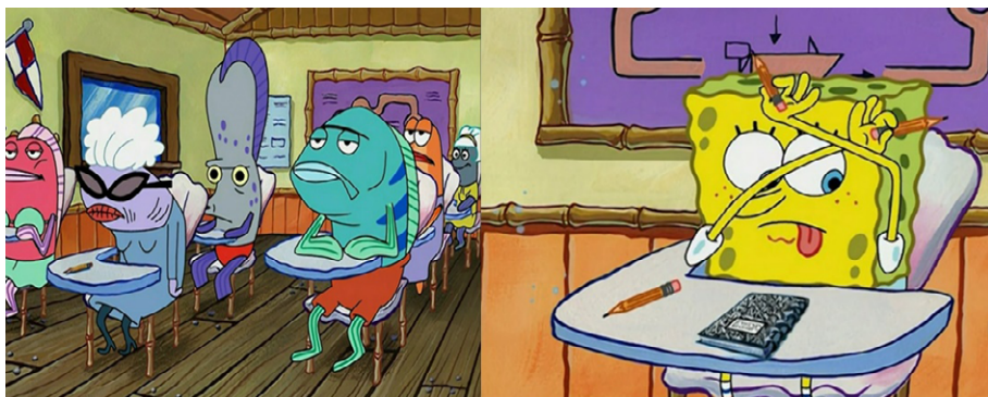
Ilustración 1. Imágenes de los personajes secundarios y principal. Capítulo “El matón”, serie animada “Bob Esponja”.