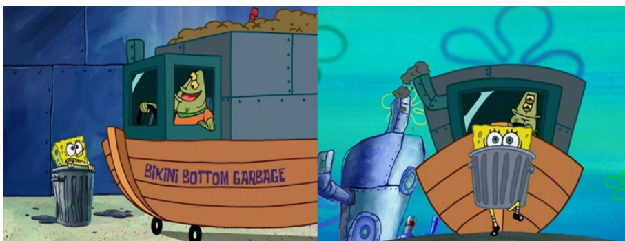
Ilustración 3. Violencia física perpetrada por Plano al protagonista. Capítulo “El Matón”, serie animada “Bob Esponja”.

La animación continúa en la siguiente escena con Plano golpeando de manera constante al protagonista en diferentes escenarios sin éxito alguno hasta que, extenuado, se desploma en el salón de clases. Luego de cesada la violencia emitida por el lenguado, los estudiantes del curso muestran su agrado y aplauden frente al cuerpo del pez abusador. Esta conducta no es bien recibida por el protagonista, quien los exhorta a considerar que, pese a todo los intentos perpetrados por el lenguado para ejercer violencia, él es la verdadera víctima a causa de las actitudes violentas que la sociedad le ha enseñado. El cortometraje termina con Mrs. Puff entrando por la puerta y malinterpretando irónicamente al protagonista como el victimario y al lenguado como el damnificado.