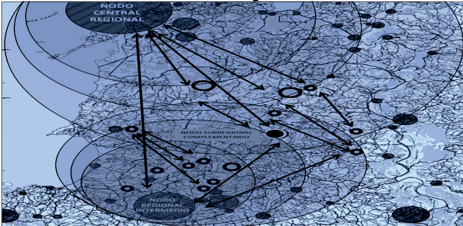
Diagrama 4 Influencia de los Nodos Subregionales en el Desarrollo