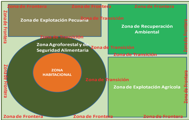
Diagrama 2 Finca Montemariana