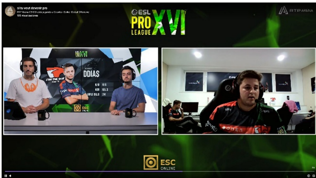
Figura 4: Programa de metodología de juego en RTP Arena con profesionales del gaming.

(DR/RTP): En la televisión tradicional emitimos 35 veces por año, y en horarios potentes de la parrilla. El programa comenzó como un repaso de las principales noticias de gaming de la semana, pero nos dimos cuenta de que era muy superficial y lo convertimos en un talk show con profesionales del sector. Estos dan claves de su metodología, e incluso juegan partidas en directo explicando algunos trucos.