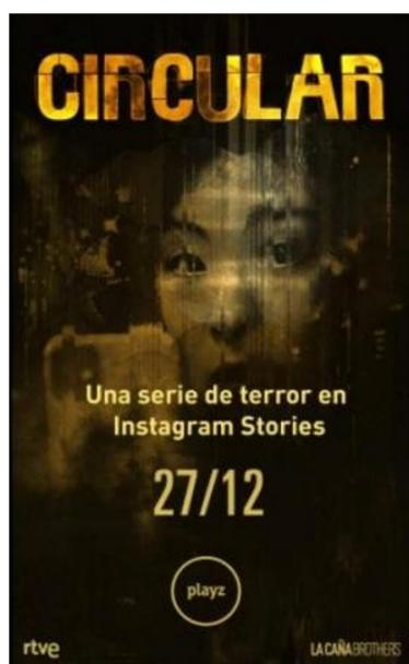
Figura 2: Portada vertical para Instagram Stories de la serie ‘Circular’ de PlayZ.

La estrategia de producción de PlayZ se basa en la creación de contenidos nativos digitales, apostando por series transmedia interactivas y producciones en formato vertical pensadas para distribuir en Instagram Stories , como el caso de “Circular” (Figura 2). Asimismo, tienen una línea enfocada a contenidos urbanos, con una estrecha relación con el freestyle o rap improvisado, numerosos documentales y formatos de actualidad, como el ya comentado Gen de Playz.