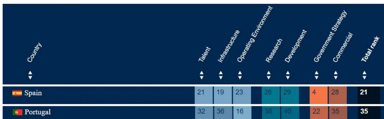
Figura 1: Posición de España y Portugal en el Ranking Global de IA de Tortoise Media (2022).

Según el índice global de inteligencia artificial elaborado por Tortoise Media (2022), en el que se analizan diferentes parámetros relacionados con la inteligencia artificial, como talento, infraestructura, ambiente operacional, investigación, desarrollo, estrategia del gobierno y apartado comercial, España ocupa el puesto 21 del ranking general, liderado por los EEUU, siendo considerada la estrategia del gobierno español la cuarta mejor del mundo; mientras que Portugal se sitúa en la posición número 35 de la escala (Figura 1).