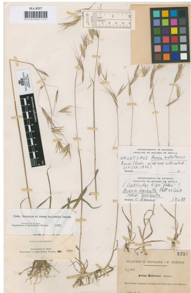
Figura 1. Holotipo de Avena matritensis B.R. Baum (MA 8257).

hirtula corresponden al tipo de Lagasca, sino más bien a una mezcla de especies que incluiría a A. lusitanica , A. castellana o ambas. A la luz de esta revelación, queda claro que Loskutov (entre otros) sigue la estela de Malsev, y que en el ámbito de los bancos de genes y germoplasma se está etiquetando a las muestras con nombres que no les corresponden. Es lamentable que algunos estudios citogenéticos y moleculares carezcan de las garantías y la transparencia necesaria para la comprobación de sus testimonios y que no presten atención al principio de tipificación, sino a la tradición de cada escuela.