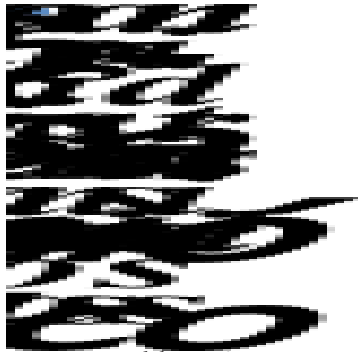
Figura 1: Enfoque Onto-Semiótico del Conocimiento y la Instrucción Matemática (EOS)

Se presenta, así, a continuación el enfoque 4 base para llevar a cabo la investigación, que se utiliza como referente base para realizar el análisis y caracterización la evaluación de los significados personales en una secuencia de actividades.