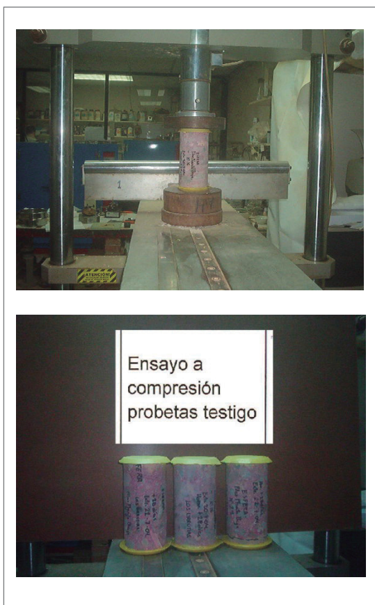
Figura 3. Dos detalles del proceso de ensayo de probetas testigo de hormigón, tras su extracción, tallado y refrentado. Véase el trazado de las grietas que presenta el proceso de rotura.