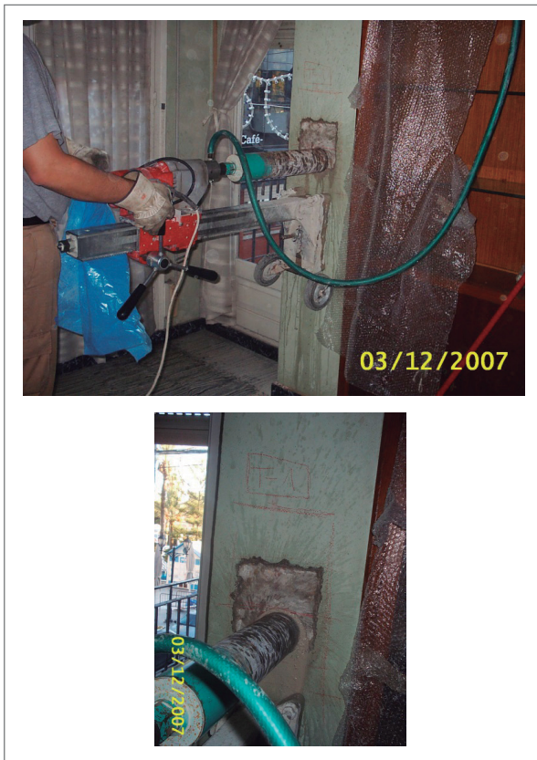
Figura 2. Proceso de extracción de una probeta testigo de hormigón, tras la realización del ensayo mediante ultrasonidos. Véase la corona de diamante para la extracción y el orificio que deja la actuación.