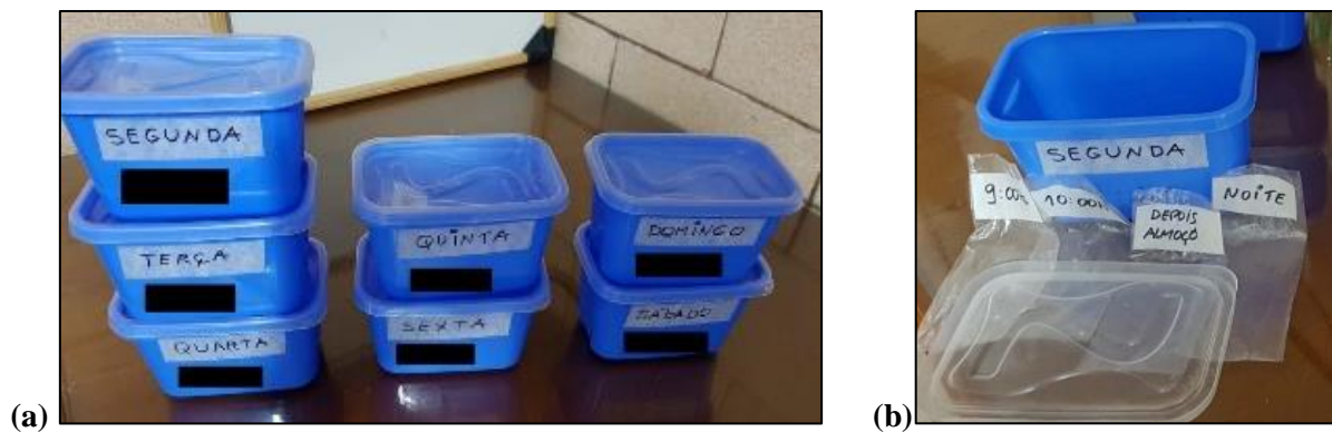
Figura 3: Comunicação entre a Participante F2 e a cuidadora

A participante F2 informou que nos finais de semana ela separa todos os remédios em pequenos lotes (sacos) identificados com os turnos que devem ser ministrados. Os lotes são colocados em caixas com o dia da semana e o nome do(a) idoso(a), conforme Figuras 3 (a) e (b).