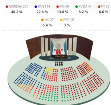
Figura 1 Porcentaje de diputados federales por grupo parlamentario. LXV Legislatura

Nota: Imagen tomada de Cámara de Diputados Federal. Diputada(o)s en Pleno (20 de marzo de 2023)