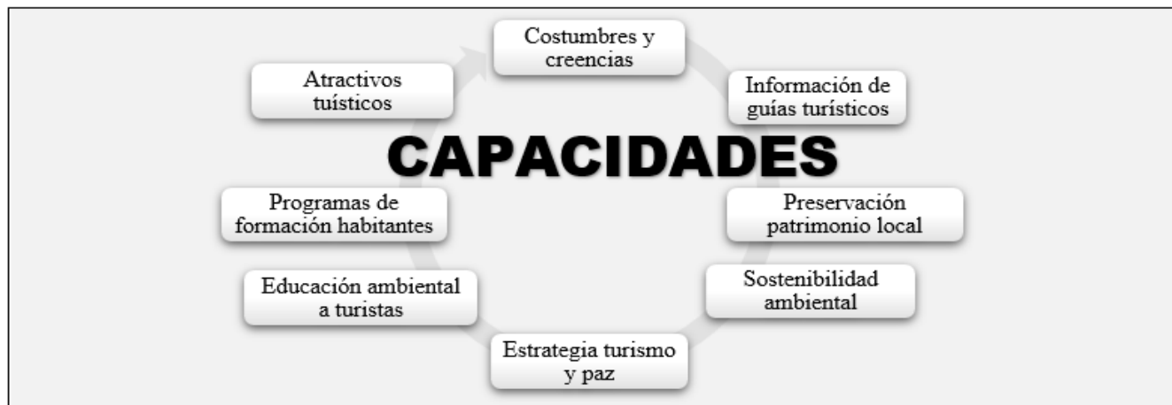
Figura 4. Capacidades para el turismo de naturaleza en la zona centro

de los productos turísticos a partir de los atractivos naturales, b) Planificación de esquemas para la sostenibilidad, c) Formación de agentes y guías turísticos, d) Promoción de sitios turísticos, e) Costumbres, creencias y valores de los habitantes de la región, f) Estrategia de turismo y paz liderada por el MinCIT (2018) para impulsar el sector turismo en el país, g) Preservación del patrimonio local, i) Educación ambiental a turistas y habitantes de la zona estudiada.