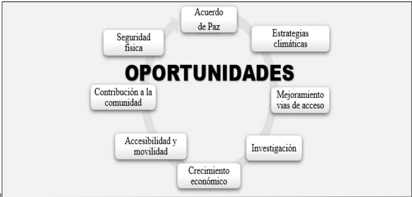
Figura 3. Oportunidades para el turismo de naturaleza en la zona centro