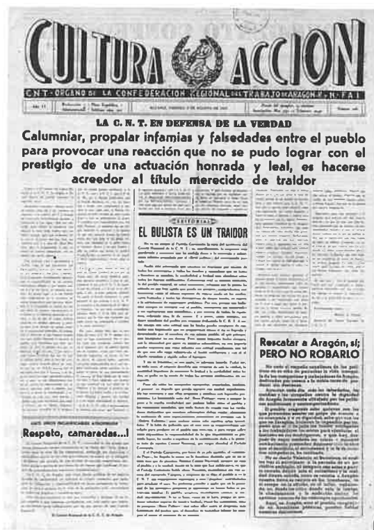
Ejemplar de Cultura y acción.

Pero el momento en 1933 es otro y los libertarios son mayoría en el Centro. La biblioteca sigue recibiendo los dos periódicos republicanos y a ellos se une durante un breve periodo Crisol . Diario de la República rotativo madrileño propiedad de Nicolás María de Urgoiti, magnate de la prensa al que también está vinculado El Sol . Los anarquistas han conseguido que se reciban también Solidaridad Obrera y Cultura y Acción , portavoces respectivos de las regionales cenetistas catalana y aragonesa, aunque el primero con una raigambre que le presenta como vocero directo del propio Comité Nacional confederal muchas veces instalado en la Ciudad Condal. Tanto la "Soli" como La Libertad y El Sol se harán particular eco de los sucesos revolucionarios de diciembre de 1933 y de la penosa situación de los presos preventivos masinos en la cárcel de Castellote, aunque después se publicó en el periódico anarquista a partir de su nueva puesta en la calle, a comienzos de abril de 1934 tras cuatro meses de prohibición.