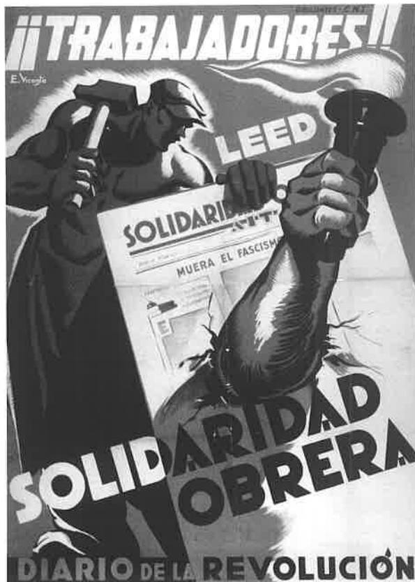
Cartel de Solidaridad Obrera.