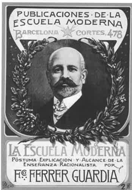
Portada de publicación Ferrer Guardia.

La filosofía de la escuela racionalista era sustituir los métodos, de memorización, fe ciega y orden. Por los del descubrimiento y el saber a base de la razón, la libertad de preguntar, potenciar la curiosidad del niño y la igualdad de clases y sexos. Fue una época maravillosa para mí, pues estaba entusiasmado con el aprendizaje de las matemáticas, la geografía y la historia, contaba con ocho años y era un niño que lo absorbía todo, con lo cual mi nivel de cultura y conocimientos superaba en mucho el supuesto para mi edad.