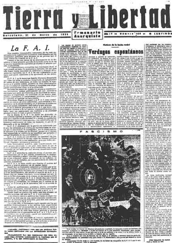
Ejemplar de Tierra y Libertad del 31 de marzo de 1933.

el recientemente creado Ateneo Racionalista de Torrero en marzo de 1933 o por el Ateneo Libertario de Huesca en septiembre del mismo año en el Teatro Odeón de la capital oscense. Pueblos donde el tejido libertario es especialmente combativo, como es el caso de Alcalá de Gurrea, próximo a las obras del pantano de La Sotoneira, mostrarán una actividad febril con la actividad del Grupo Artístico Sol y Vida durante la primera mitad de 1936. La presencia de las columnas en los primeros meses de la guerra también fomentará la realización de festivales incluso en pueblos muy próximos a la línea de frente, pero sobre todo Caspe capitalizará la programación con la presencia de compañías dramáticas en el Teatro Goya que popularizan más si cabe las obras de autores como el bilbilitano Joaquín Dicenta, Alejandro Casona o Jacinto Benavente. Este último incluso publica un artículo en el Boletín de un Consejo de Aragón que llega a editar Un ensayo de teatro experimental del anarquista Mateo Santos, casi en vísperas de su disolución.