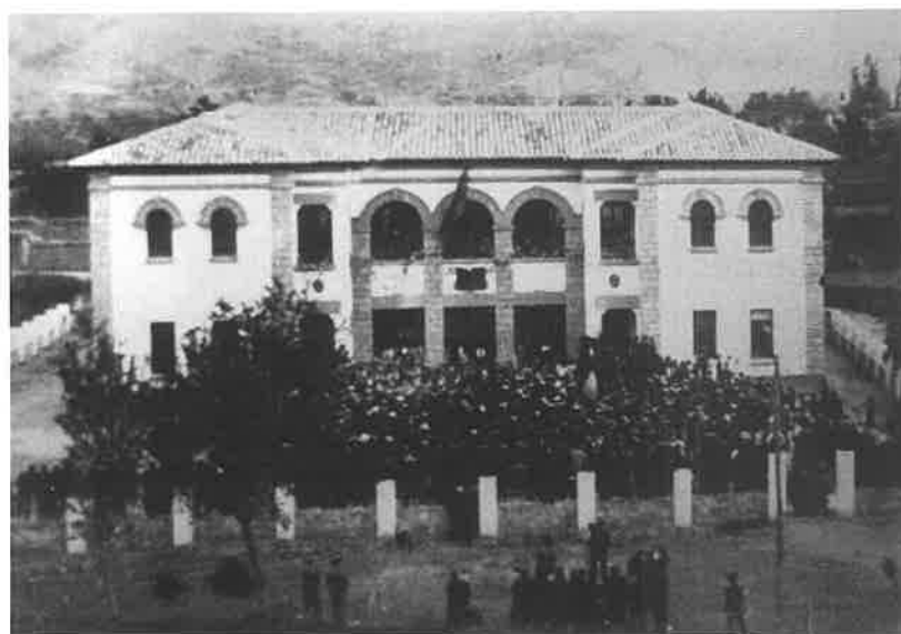
Inauguración del Grupo escolar Luis Bello en 1936.

Algunos de los avatares constructivos del grupo escolar los podemos seguir a través de las actas de los plenos del Ayuntamiento de Mas de las Matas que se encuentra en la Caja 12 del Archivo de Salamanca.