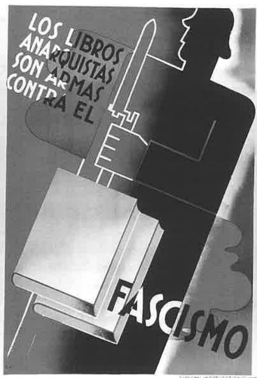
Libros anarquistas contra el fascismo.