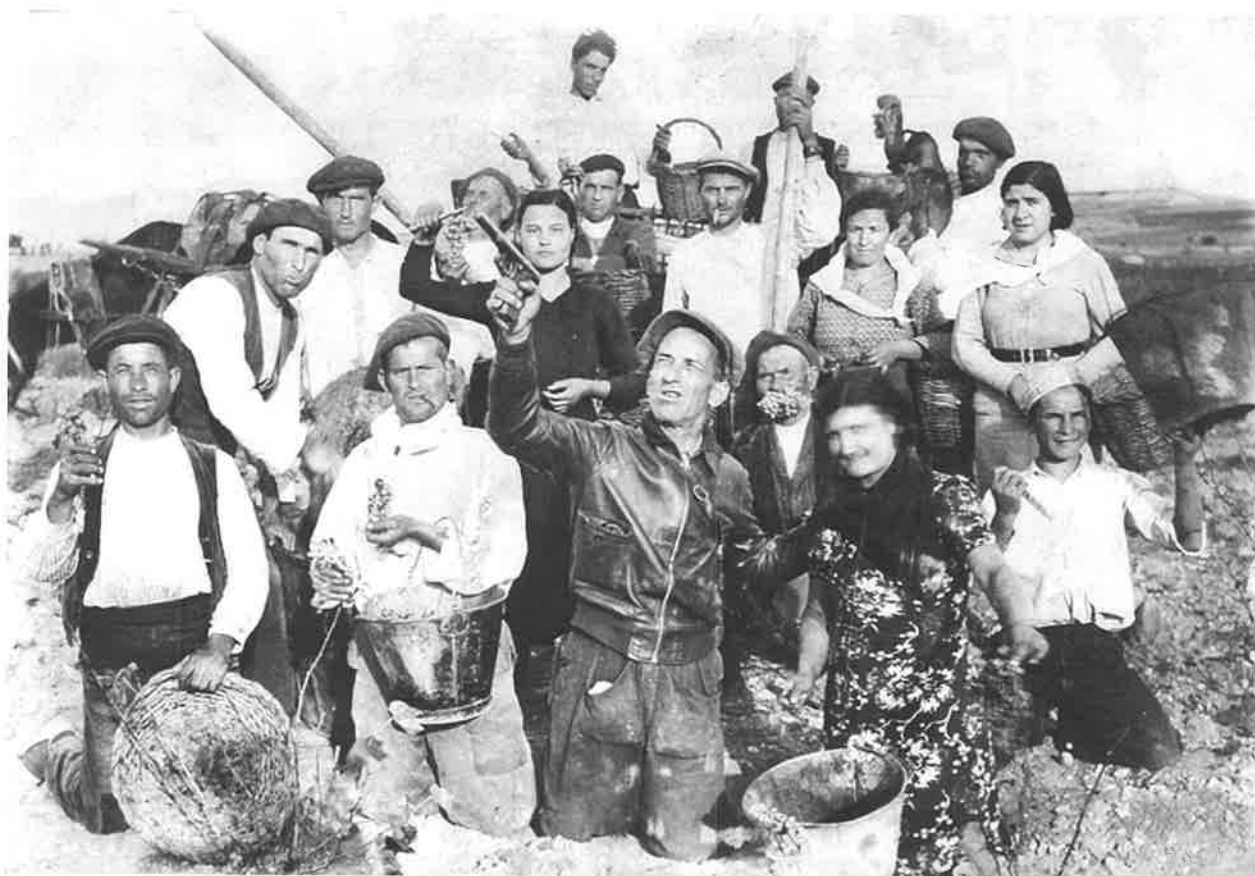
Vendimiadores en Mas de las Matas, hacia 1936-37.

En la foto aparecen setenta y un masinos, jóvenes y niños de diferentes edades, y casi la mitad de ellos portan periódicos y revistas que muestran a la cámara. Se trata del grupo de alumnos de la escuela racionalista creada por el Ateneo Libertario que se formó en 1933 en el seno del antiguo Centro Republicano. Hemos podido identificar a algunos de ellos, pero no a todos, y debemos pensar que uno de los que aparece es el maestro que el Centro contrató en el entorno de la CNT barcelonesa. Era una pauta habitual en aquellos años que los grupos anarquistas se dotaran de una escuela al margen de la oficial para transmisión y adoctrinamiento de sus ideas, pero sorprende el testimonio gráfico porque además nos ha permitido conocer y fechar los ejemplares de la prensa libertaria con los que trabajaban. Nos muestran diversos números de los periódicos, semanales o mensuales, Tierra y Libertad , El Libertario , Nueva Humanidad y su suplemento infantil Libertín , CNT , así como un ejemplar de la revista Estudios editada en Valencia y que ocupa el lugar central de la foto debido al enorme prestigio que entre los anarquistas y librepensadores tenía en la época. Precisamente las por-