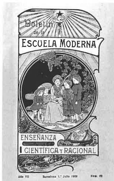
Boletín de la Escuela Moderna.

En cuanto a las actividades que ahora llamamos extraescolares destacan las charlas y conferencias que se daban a los alumnos por parte de personalidades en diversas materias. Se trataba a través de ellas de infundir en el alumnado nuevos modos de vida: lucha contra los vicios (fumar, beber, holgazanear...). El material escolar fue adquirido a una casa comercial zaragozana, adquiriéndose el material más moderno en vigor esos años: mesas individuales, mesas de grupos, pizarras, mapas, cartas-murales. Según nuestro comunicante, existía otra escuela de características muy parecidas a esta en Valderrobres (Teruel), pero ha sido imposible conocer algún dato sobre ella.