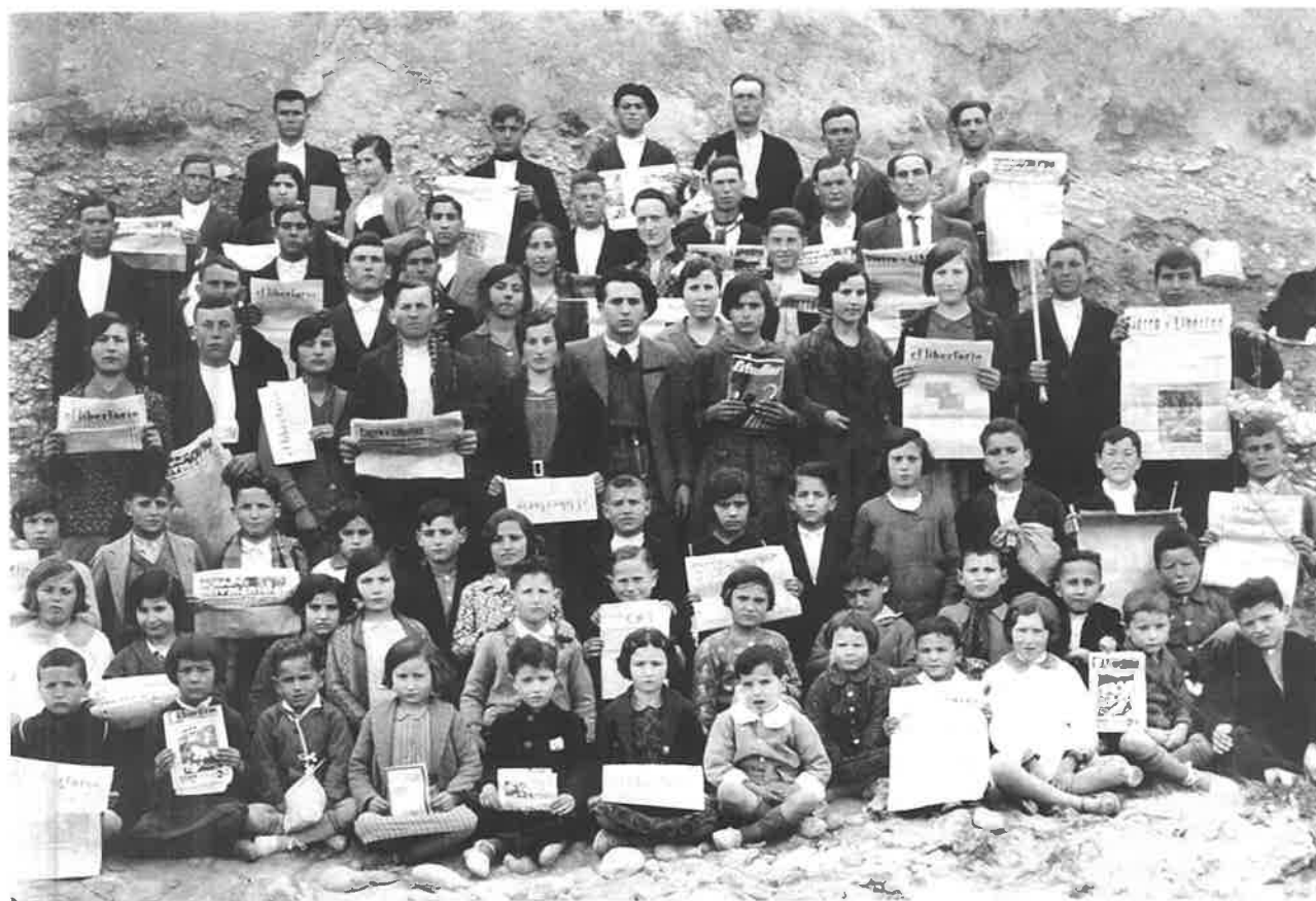
Alumnos del Ateneo Libertario de Mas de las Matas portando periódicos en 1933.