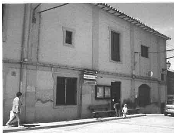
Centro Republicano en Mas de las Matas.

Las clases no superaban los 40 alumnos, aunque chicos y chicas estábamos separados, los textos eran gratis, el sistema de la enseñanza cambió totalmente, la represión no estaba bien vista, pero se seguía escrupulosamente los programas, mucho del aprendizaje se basaba aún en la memoria. Disponíamos de mesa para cuatro, con su cajón para guardar los libros. 7