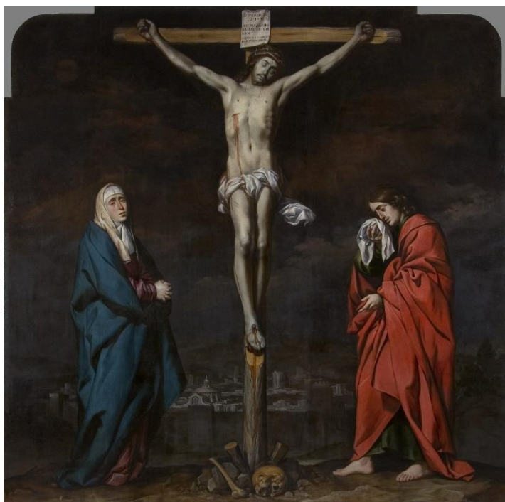
Fig. 3. Calvario . Antonio del Castillo. Circa 1650. Museo de Bellas Artes, Córdoba.

este periodo: la pintura al óleo sobre lienzo con representación del Calvario para la capilla de la cárcel del tribunal de la Inquisición, ubicada en el actual salón de los Mosaicos del alcázar cordobés. La obra, pensada para conmover la conciencia de los reos, presenta la figura de Cristo ya fallecido y clavado sobre una cruz semidesbastada, a cuyos pies lloran afligidos la Virgen María y San Juan, el discípulo predilecto. Al fondo de la composición, la ciudad de Jerusalén asoma en la penumbra con una muralla probablemente inspirada en la propia fortaleza medieval de la ciudad de Córdoba [fig. 3]. En 1811 la obra pasó a la capilla de la cárcel provincial, también instalada en el alcázar y, finalmente, en 1866, gracias a la intervención de Rafael Romero Barros -padre del reconocido pintor simbolista Julio Romero de Torres- la obra entró a formar parte de la colección del Museo de Bellas Artes de la ciudad 15 .