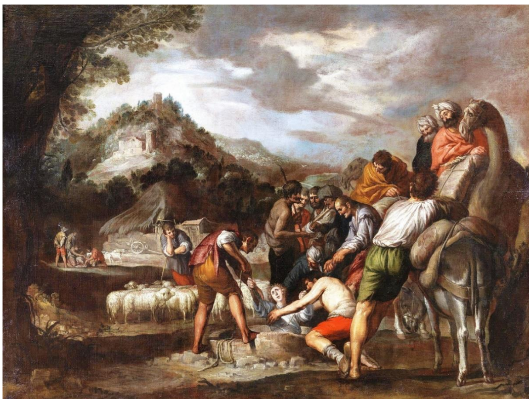
Fig. 6. José vendido por sus hermanos . Antonio del Castillo. Circa 1655. Museo Nacional del Prado, Madrid.

sus hermanos , donde existe una correspondencia directa entre el personaje del primer plano que se apoya en un burro, y el que reproduce años antes en uno de los dibujos de escenas campesinas conservado en la madrileña Academia de San Fernando 18 [fig. 6]. Esta forma de componer ilustra, por tanto, el complejo proceso creativo de Castillo, en el que la estampa, el dibujo y el lienzo se conjugan para acentuar el sentido narrativo de su pintura, recreando una atmósfera verosímil con recursos que no necesariamente implican pintar al natural.