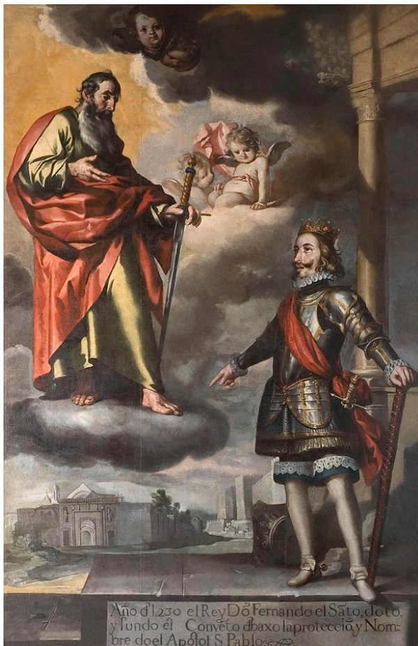
Fig. 7. San Fernando dedicando la fundación del convento de San Pablo . Antonio del Castillo. Circa 1655. Museo de Bellas Artes de Córdoba.

representaciones y ubicación aproximada en el emplazamiento. Así, el rellano principal lo ocupaba el gran cuadro con representación de San Fernando dedicando la fundación del convento de San Pablo , que alude al propósito fundacional de los dominicos de convertir al cristianismo la Córdoba musulmana tras la conquista de la ciudad en 1236 por el monarca Fernando III [fig. 7]. Junto a este gran cuadro, en la pared de enfrente, se situaba el lienzo con representación de Santa María Magdalena y Santa Catalina de Alejandría , en el que se subrayaba el carácter penitencial e intelectual de estas dos santas de especial devoción para los dominicos [fig. 8]. Los restantes cuadros se organizaron en parejas, distribuidas armónicamente por el resto de la caja de la escalera: Santo Tomás de Aquino, San Buenaventura, Santo Domingo de Guzmán, San Francisco de Asís, San Vicente Ferrer, San Pedro Mártir de Verona, San Antonio de Padua y San Bernardino , cada uno singularizado con sus principales atributos iconográficos y con rostros sumamente expresivos [fig. 9] 19 .