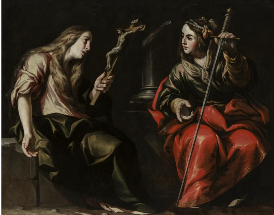
Fig. 8. Santa María Magdalena y Santa Catalina de Alejandría . Antonio del Castillo. Circa 1655. Museo de Bellas Artes de Córdoba.