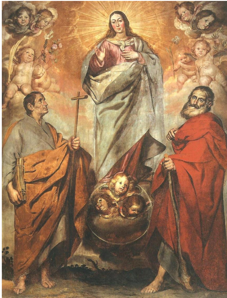
Fig. 5. Inmaculada con san Felipe y Santiago el Menor. Antonio del Castillo, 1652-1654. Catedral de Córdoba.

Terminada esta obra, Castillo contrató uno de sus encargos más famosos y a la vez complejos desde el punto de vista compositivo: la serie de la Vida de José , seis pinturas de hacia 1655 basadas en el relato veterotestamentario donde el artista experimenta ese particular naturalismo importado de las estampas y fuentes grabadas europeas, tan utilizadas y de moda en el arte español de mediados del Seiscientos 17 . Según esto, el tipo de cabaña con tablonés y paja que se sitúa al fondo de la escena, recuerda uno de los grabados de Bolswert sobre composición original de Bloemaert, de gran belleza y cuidada escenografía. Pero también advertimos en estos cuadros elementos muy personales que remiten a algunos de los dibujos preparatorios del propio maestro, como ocurre de un modo muy especial en el lienzo de José vendido por