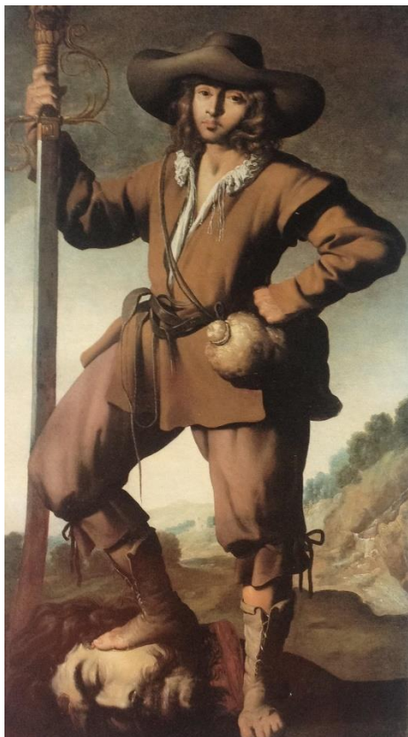
Fig. 1. David con la cabeza de Goliat . Francisco de Zurbarán. Circa 1630. Colección privada.

con la cabeza de Goliat de la neoyorquina colección Paul Berliz, firmada con el anagrama "A. C", donde resulta evidente la absorción del estilo zurbaranesco, especialmente en el tipo de dibujo prieto, colorido de gama cálida y el tipo de pose y expresión arrogante del personaje, características excepcionales de esta composición que, salvo en muy pocos casos posteriores, volveremos a identificar [figs. 1 y 2].