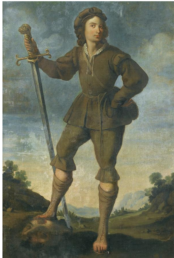
Fig. 2. David con la cabeza de Goliat . Antonio del Castillo. Circa 1637. Colección Paul Berliz, Nueva York.

Esta etapa en Sevilla benefició, por tanto, al joven Castillo en la adopción de la tendencia naturalista que, a lo largo de sus años de actividad profesional, perfeccionó hasta convertirla en la gran protagonista de su lenguaje creativo. Sin embargo, la estancia sevillana debió ser breve ya que, en junio de 1635, el artista reside oficialmente en Córdoba, preparado para contraer matrimonio con Catalina de la Nava, una mujer mayor que él, viuda y madre de dos hijos aún menores de edad: Francisca y Andrés 9 . En este momento, Castillo -que tenía 19 años-, se encontraba en edad madura y perfecta para casarse, tras haber concluido satisfactoriamente su aprendizaje artístico y, por ende, estaría dispuesto a fundar su propio obrador e iniciar su actividad profesional, algo que -en el terreno personal- era fundamental para poder ayudar económicamente a su madre viuda y hermanos.