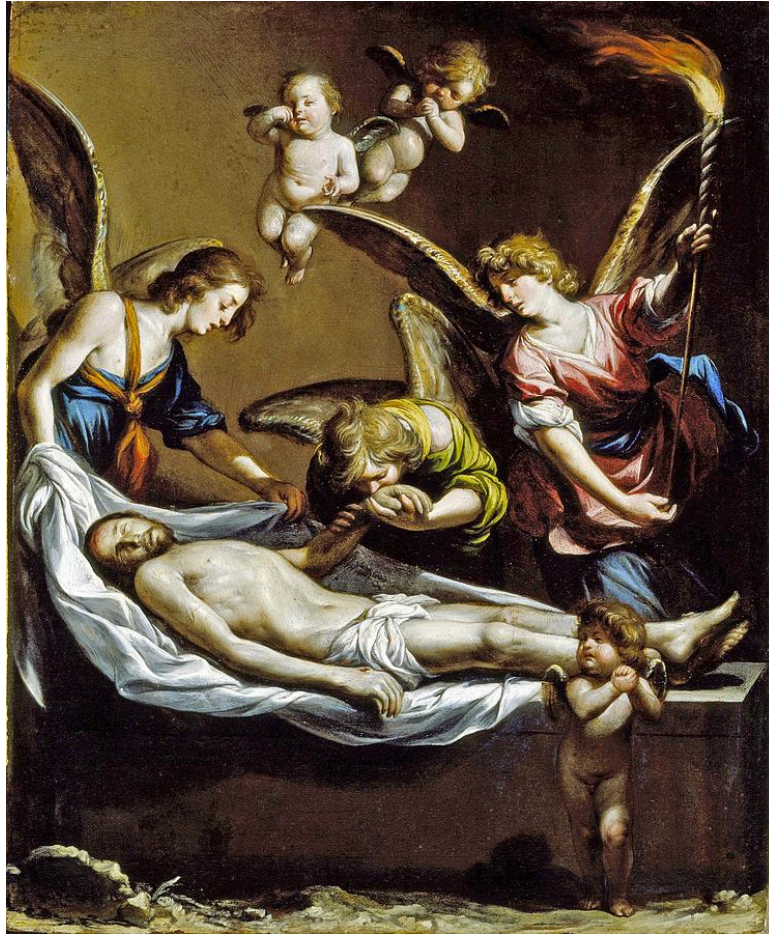
Fig. 4. Cristo muerto y tres ángeles dolientes. Antonio del Castillo. 1650. County Museum, Los Ángeles, Estados Unidos.