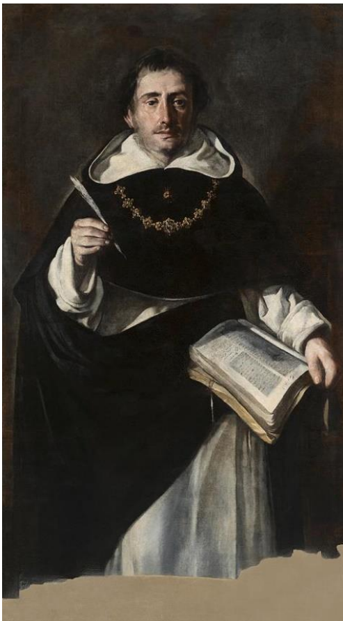
Fig. 9. Santo Tomás de Aquino . Antonio del Castillo. Circa 1655. Museo de Bellas Artes de Córdoba.