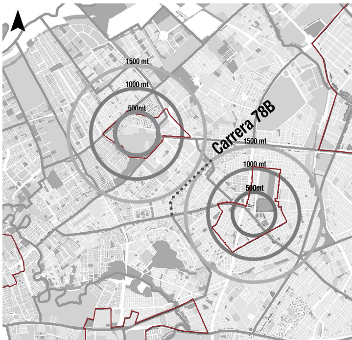
Figura 2. Esquema de equidistancia de la cra. 78B a las centralidades Américas y Corabastos

Pudo concluirse que el alto precio del suelo es fruto de la renta de un suelo muy demandado 8 hasta el punto de ser adquirido por grandes cadenas comerciales, lo que evidencia la teoría del bid rent . Cabe destacar que algunos de los almacenes de cadena mencionados tienen sucursales también en el Centro Comercial Plaza de las Américas. Esta replicación de usos puede llegar a considerarse como la demostración de la teoría que indica que cuando la distancia se