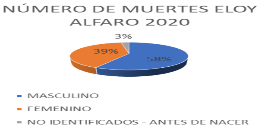
Gráfico 1. Porcentaje de muertes por sexo.

En el siguiente gráfico se observa que el mayor porcentaje de muertes se da en el sexo masculino, esto es algo que se replica a nivel nacional y a nivel mundial, ya que según la OMS 7 la mujer tiene un promedio de 4,4 años más de vida, esto se puede dar porque las mujeres a nivel general se cuidan más, en los hombres hay muertes asociadas a violencia, accidentes de tránsito, cáncer de próstata, entre otros.