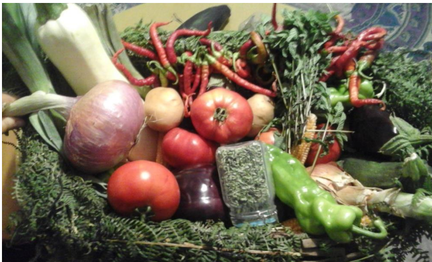
Imagen 1. Cesta de verduras de un productor.