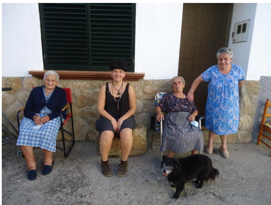
Imagen 2. Vecinas de Casas del Castañar.

“La Tierra no es una herencia de nuestros padres, sino un préstamo de nuestros hijos” (Proverbio Indio)