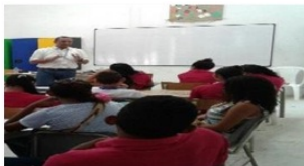
Imagen 1. Charla importancia del ambiente en la vida del hombre.

3. Actividad: Organizar una charla sobre la importancia del ambiente en la vida del hombre.