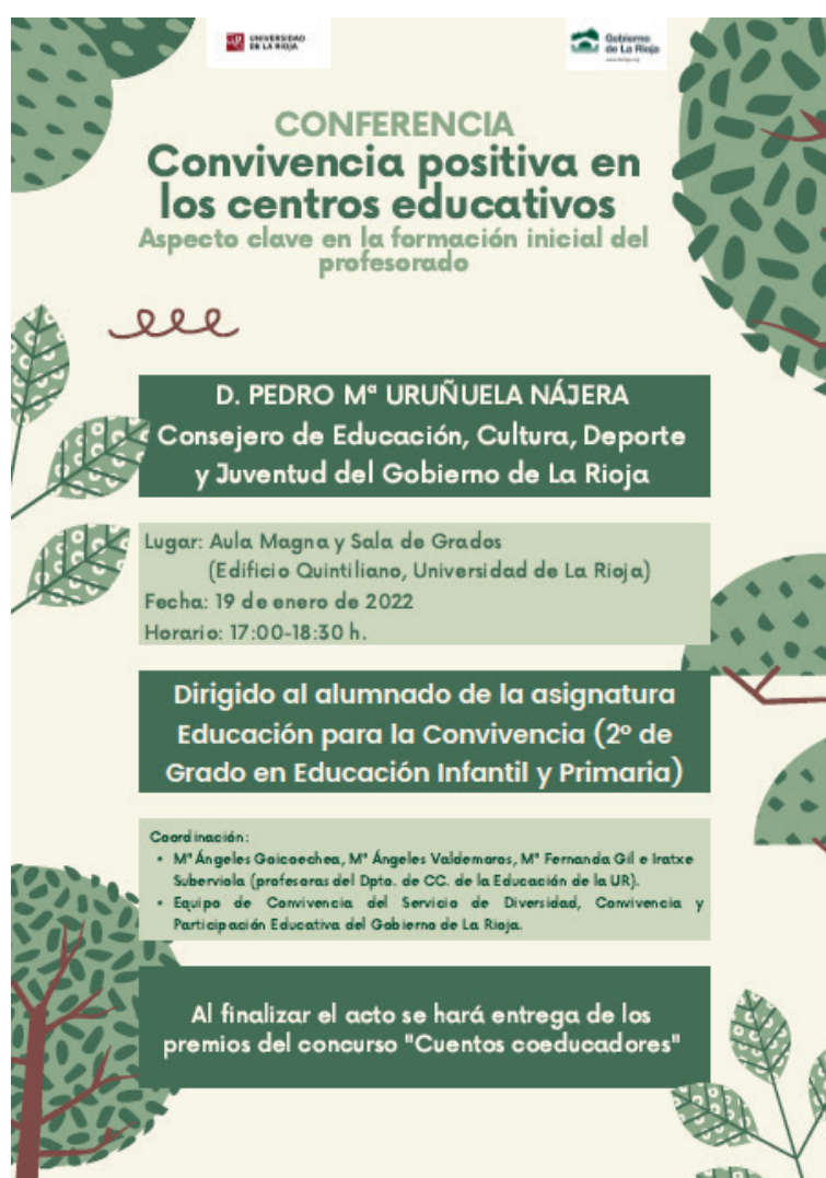
Figura 5. Cartel anunciador entrega de premios

Entregó los premios el Consejero de Educación Cultura, Deporte y Juventud del Gobierno de La Rioja, D. Pedro M a Uruñuela Nájera, tras impartir una conferencia (Figura 5) en el Aula Magna de la Universidad de La Rioja, que sirvió para que el alumnado afianzara los contenidos de la asignatura y culminar esta experiencia. La finalidad de este proyecto no fue nunca la competición, pero utilizó el formato de concurso para incentivar y reconocer el trabajo bien hecho.