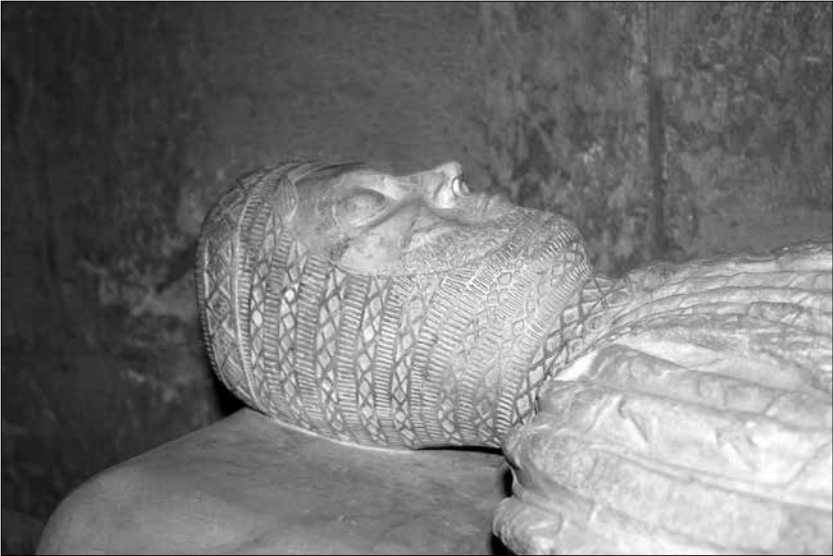
Detall del sepulcre de Berenguer de Puigverd, restaurat per Maties Solé Maseres

Celdoni. Els altres molins descrits, fins a tocar al terme de Vilaverd, serien els tres descrits a la partida de Llorac.