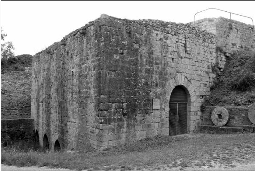
Façana nord del Molí de la Volta, amb la porta d'entrada a la sala de tramuges.