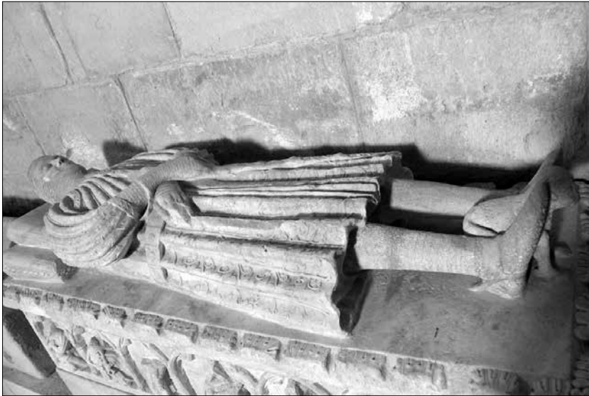
Sepulcre de Berenguer de Puigvert, a la galilea de l'església del monestir de Poblet.

En la redacció de l'esmentat capbreu s'endevina un cert ordre en les inscripcions: així, abans de l'anotació del molí de l'ardiaca «de Puigvert» s'inscriví el molí de Bernat des Caus «al loc qui és appellat pas», és a dir, aquest molí es refereix a l'actual «Molí del Pas». I les dues posteriors a la del molí de l'ardiaca, incloses a la partida de Vilasalva, pertanyents al molí de Guillem Comabella i el molí de la muller de Pere de Bordell, tal vegada haurien de correspondre al Molí Xiquet i al Molí del Malet. Més enllà, el molí d'en Bernat Ninot l'hauríem d'identificar amb l'actual molí del