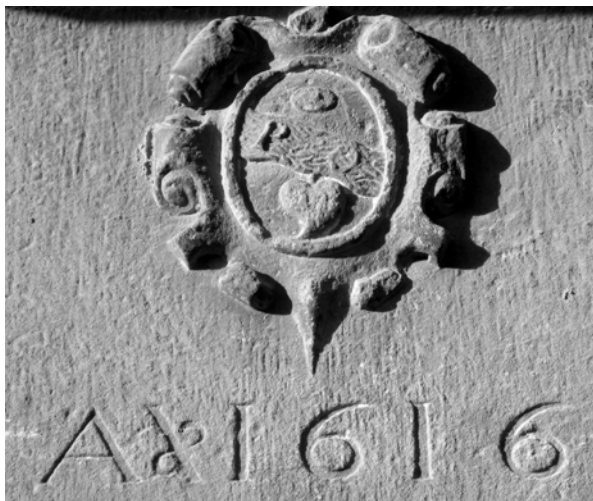
Fig. 5.- Escut heràldic dels Pocurull, datat el 1616, a l'actual Cal Blasió.

cosa que indica que havia estat subhastat; així com una petita quantitat de terra i corrals. Igualment a Bellpuig es fa referència d'una torre i molí “vulgarment dita de mossèn Ivorra olim d'en Portell”, que era un molí fariner envoltat de terres, el qual estava arrendat per 100 lliures anuals; no sabem quin molí era, si l'edifici gòtic del Molí Vell de la vila (també conegut com Molí dels Esquius de Dalt i antigament com