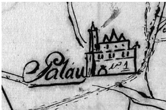
Fig. 3.- Indicatiu cartogràfic del Palau d'Anglesola a l'any 1755.

i que una petita part estava plantada d'oliveres o vinya, sumant un total de 120 jornals i 11 porques, que equivaldrien a 52'7 hectàrees; també té dos farraginals (destinats al conreu de farratge), amb un total de 10 porques (0'36 hectàrees); un tros sencer de vinya, de 3 jornals (1'3 hectàrees); i un corral per a bous. Les partides agrícoles del Palau (algunes encara vigents a l'actualitat) esmentades al document són: "Riucorp" (prop del riu Corb); camí de Linyola; la Peixera; la Bassa dolça; el Camí nou que anava a Golmés; el Pou nou; el Pou de la vila; el camí de la Font; Bassa bovera (actual Plaça Catalunya); Farrugat (entre el camí reial vell, el camí de Sidamon i el Vedat –lloc de caça–); la Coma (camí de Bellvís); les Hortes (camí de Lleida); el Prat (camí de l'Empriu); i la "Ladrosa" (prop de la sèquia de la "Baladrosa" –o que va a Ladrosa o la Drosa–, i podria equivaler a l'actual Baladruga).