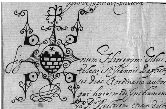
Fig. 2.- Signatura de Jeroni Mur, capellà del Palau d'Anglesola, del 1725.

joventut que corroboraria la seva vídua, amb canalla petita, la qual encara vivia l'any 1634, 25 anys després de la mort de Mateu, quan Jerònima apareix citada al capbreu fet a la població en aquest dit any (fig. 1). 5