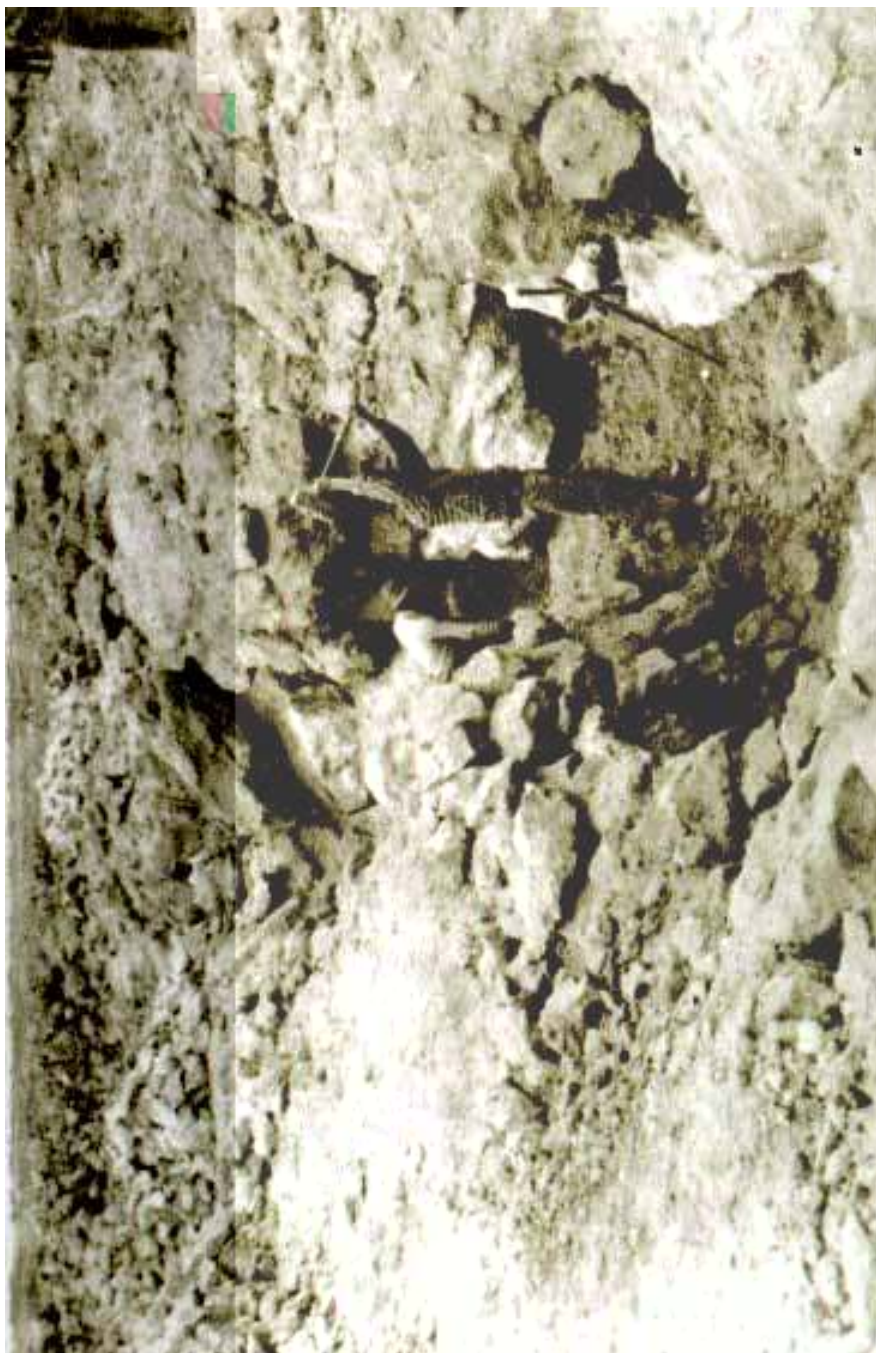
Calichera y obreros particulares en Agua Santa, 1896.