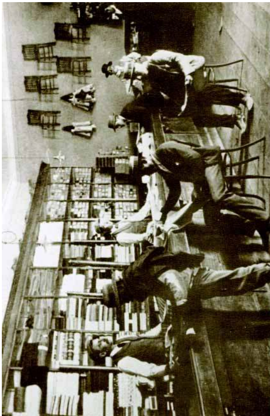
Pulpería.