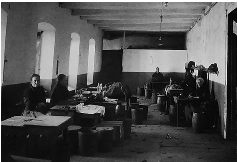
Fig. 1. Uno de los talleres de la factoría de tabacos en los últimos años del siglo XIX. Obsérvese la avanzada edad de las trabajadoras, que solían desempeñar tareas auxiliares hasta prácticamente el fin de sus días. En Fernández, Carmen / Orejas, Almudena / García, Paloma / Gil, Fernando (eds.) (2015): La Fábrica de Tabacos de Gijón. Arqueología e Historia de un espacio milenario . Gijón: Ayuntamiento de Gijón, p.36

cadadas al sector de la conserva (tanto de pescado como de manteca o embutidos), la mayoría de carácter familiar, como Conservas Alvargonzález , fundada en 1867 por Anacleto Alvargonzález 6 .