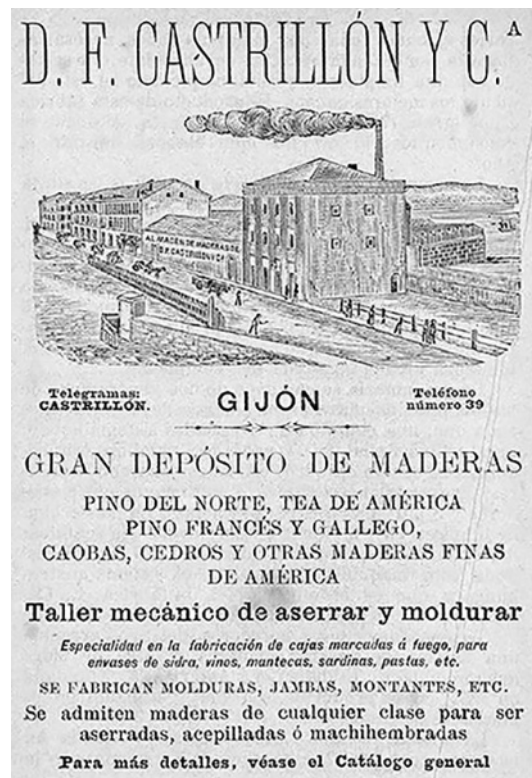
Fig. 2. Propaganda comercial de la Compañía de Maderas de Demetrio Fernández Castrillón y Méndez del Viso. En Nueva guía de Gijón (1899). Gijón: Imprenta La Económica, p.37