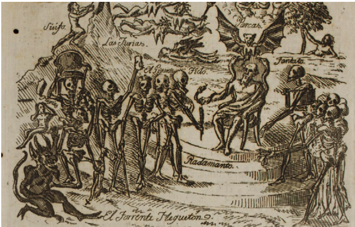
Imagen 1. Gran Logia Nación Mexicana y Pira de los Yorkinos