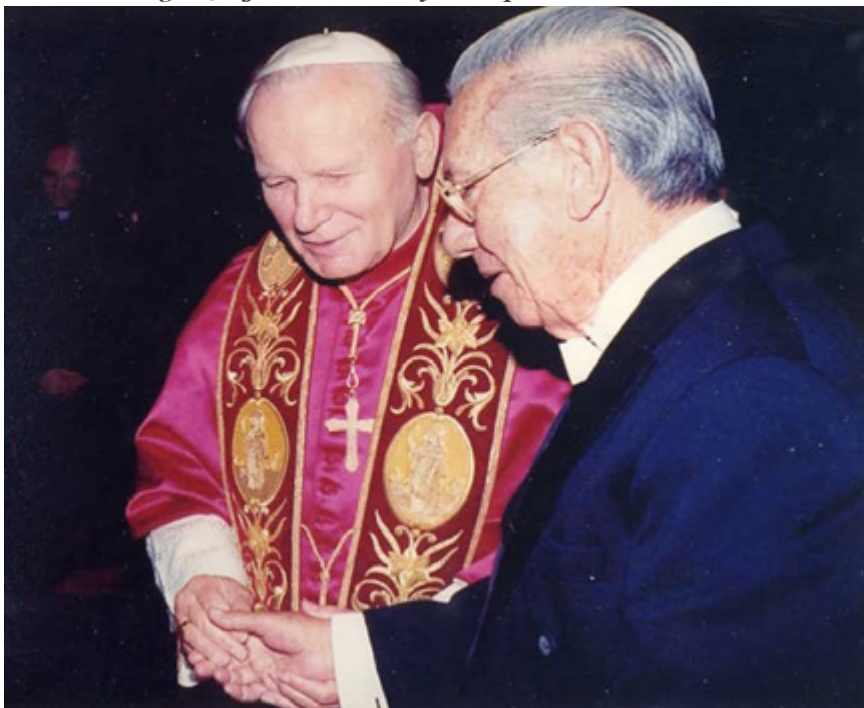
Imagen 5. Juan Pablo II y Enrique Olivares Santana