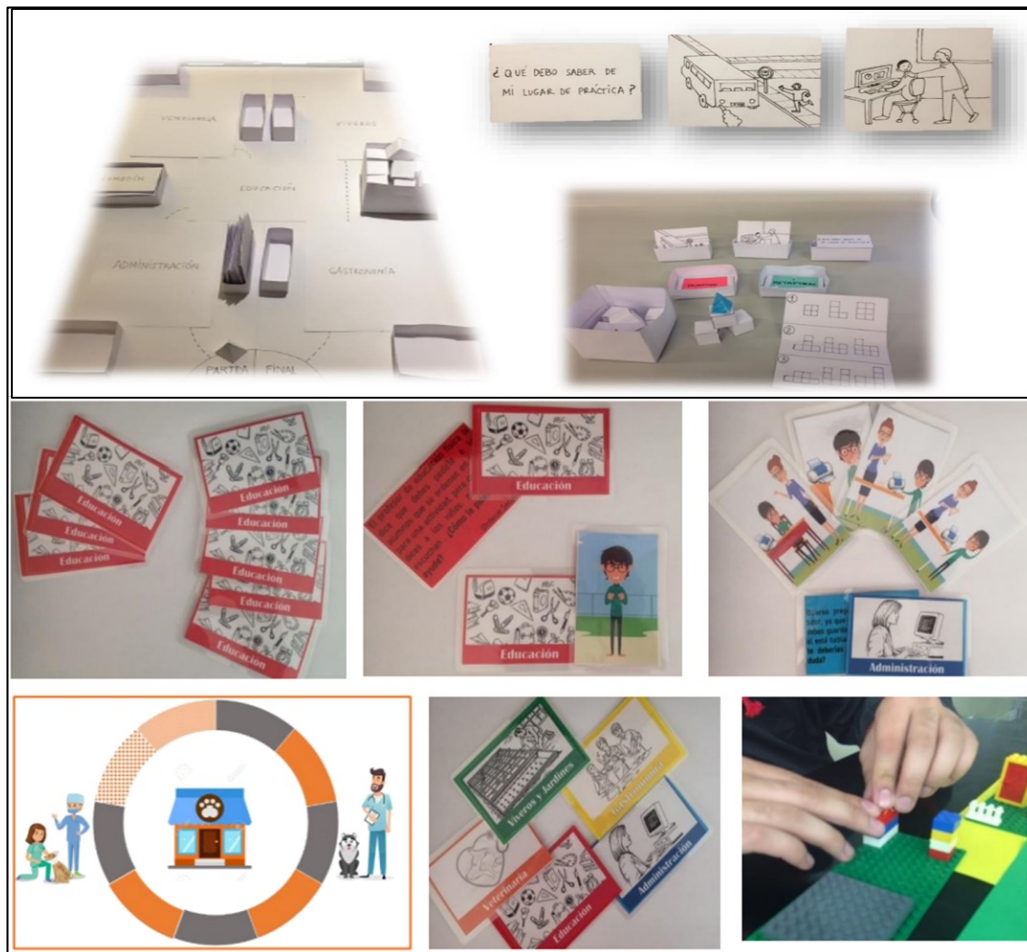
Figura 1. Progresión en la creación de la estrategia

el despliegue de dichas habilidades y fortalecer aquellas que le han permitido desenvolverse como un joven estudiante universitario con TEA. A su vez, el exponerlo a situaciones basadas en experiencias reales que se dan en las prácticas laborales, lo guiará para una elección y percepción más real de sus intereses (Guzmán, 2019).