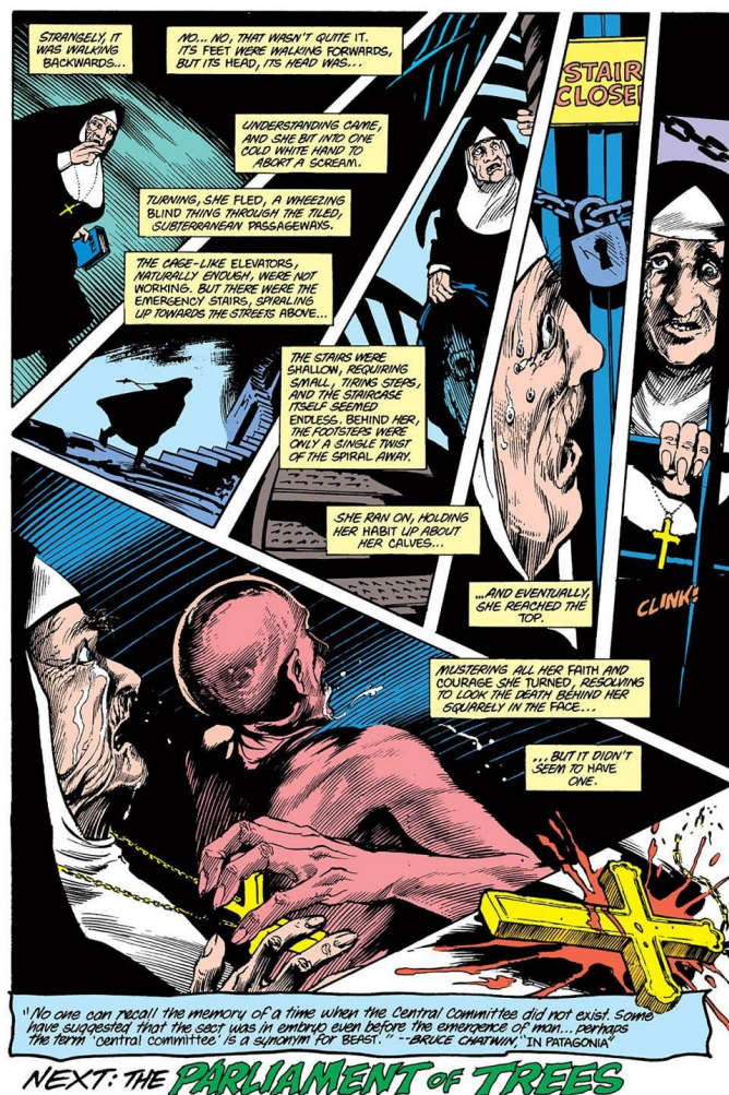
El invunche, arte de Stephen Bisette y John Topleten (textitSwamp Thing 46, p. 22)

Ahora bien, como decía, más allá del singular placer que da descubrir a Adela citando a Constantine en medio de un viaje por la Patagonia, lo que me interesa es la lectura que habilita la analogía entre la Brujería y la secta de Nuestra parte de noche . Si en el cómic se trata de abordar las repercusiones de la destrucción física que acarrea la Crisis en el plano psíquico —“This sort of physical destruction is bound to cause temporary disturbances on the psychic plane”—, la novela indaga