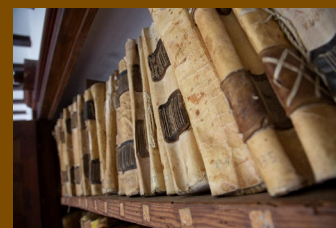
La importancia de los archivos en la investigación genealógica