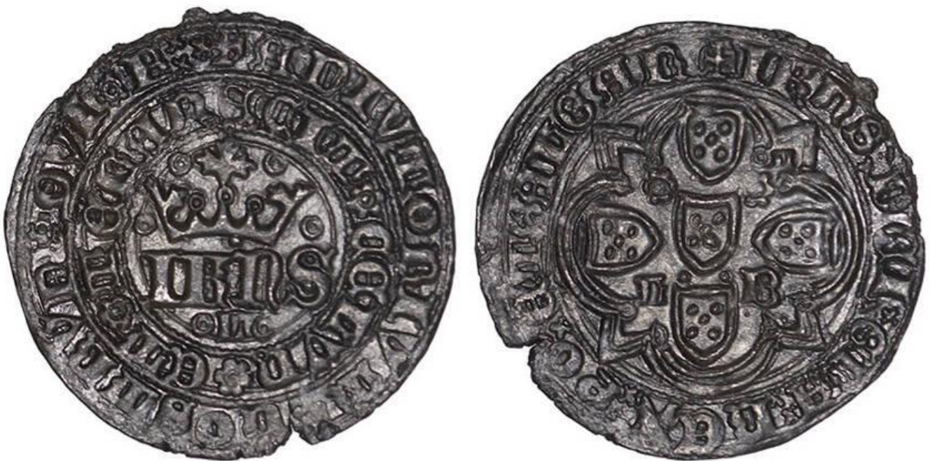
Figura 4. Real del João I (Portuscalles Numismática, subasta 3, lote 22, 15 de mayo de 2022)

Las monedas del Periodo de Interregno cuentan la historia de una reina legítima, manejada por una madre y un esposo demasiados ambiciosos, y la de un pariente ilegítimo, que aprovecha su oportunidad para instaurar una nueva dinastía. Sus piezas son el mejor ejemplo del uso que se da a estas como medio de difusión política. Las monedas son imágenes instantáneas, que cuentan lo que está ocurriendo en ese mismo momento. Son el rastro de una breve pero intensa campaña propagandística, dentro de un conflicto armado. Beatriz se representa como reina mediante el uso de su corona y es respaldada por el poder castellano, representado en su heráldica. Mientras tanto, João aparecerá con los elementos propios del maestre de Avis y defensor de Portugal, pero no podrá usar los atributos regios hasta 1385.