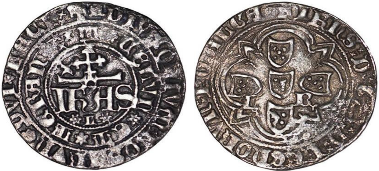
Figura 2. Real del João (Portuscalce Numismática, subasta 3, lote 18, 15 de mayo de 2022).

emisor de la moneda. Estas letras suelen estar coronadas, pero João no es rey, y no tiene derecho a usar esa distinción. En su lugar, coloca la Cruz de Avis, en referencia a la orden militar a la que pertenece.