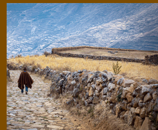
La reina y el maestro. Propaganda política a través de las monedas del Primer Interregno portugués (Parte II)

20. El Qhapaq Ñan, superviviente del paso del tiempo.