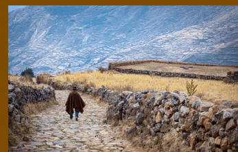
El Qhapaq Ñan, superviviente del paso del tiempo