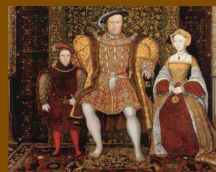
La rosa inglesa: Katherine Howard y su trágica historia