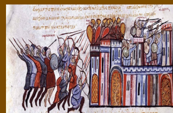
Protección ante la adversidad: un acercamiento hacia el valor mágico de la leyenda de Abgar