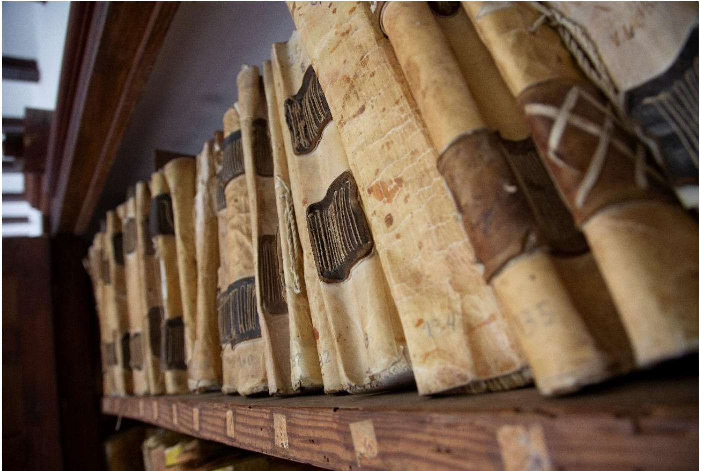
Figura 1. Detalle del Archivo Parroquial de Ntra. Sra. de La Oliva. Lebrija.

Hay que tener en cuenta que casi toda la población era cristiana en esa época, y por tanto todo esto se reflejaba tanto en los bautismos, como en los matrimonios y defunciones.