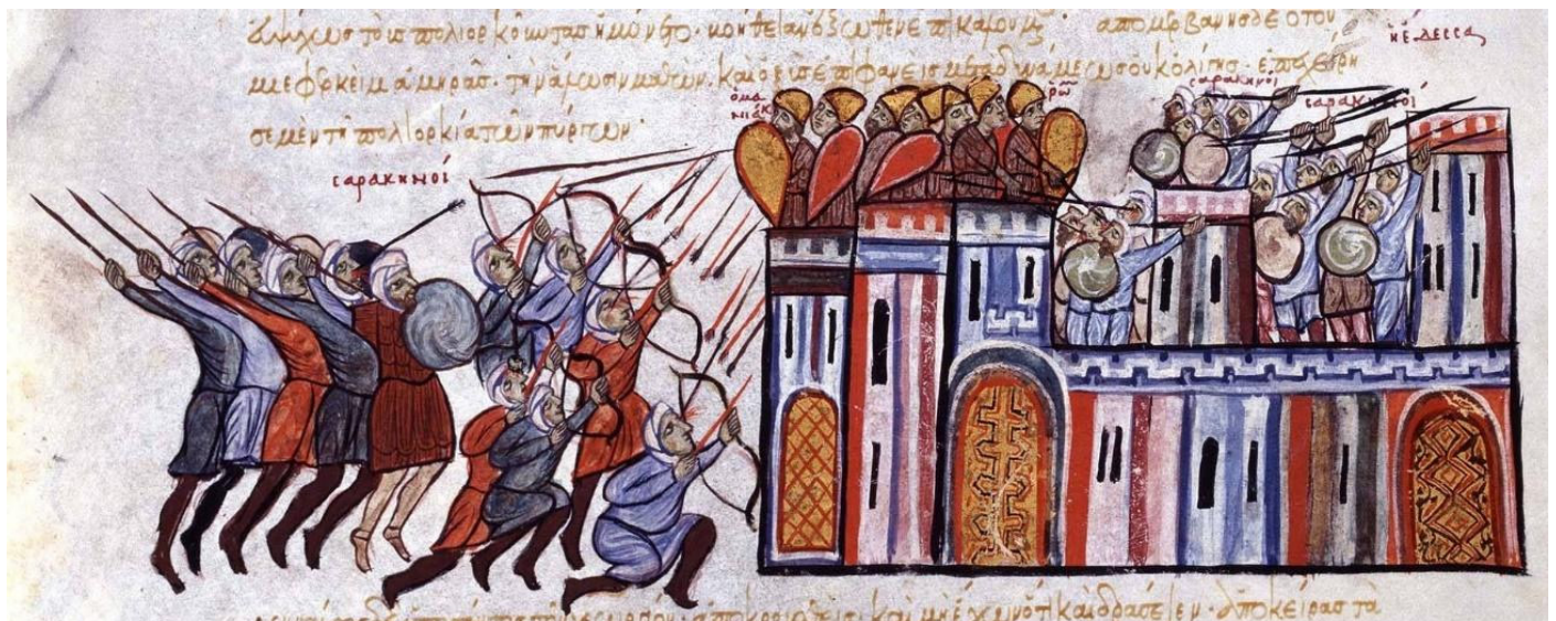
Figura 3. Defensa de la ciudad de Edesa ante el asedio musulmán.

αὐτὴ δὲ μου ἐπιστολὴ ὅπου ἂν προβληθῆ εἴτε ἐν δίκῃ ἢ ἐν δισκαστηρίῳ, εἴτε ἐν ὁδῷ εἴτε ἐν θαλάσῃ, εἴτε ἐν ῥηγιδῶσιν εἴτε ἐν πυρέσσουσιν ἢ φρικιδῶσιν ἢ εκβράζουσιν ἢ κατάδεσμον ἔχουσιν ἢ ὑπερβρασιν, ἢ φαρμακευθεῖσιν ἢ ὅσα τούτοις ὅμοια, διαλυθήσονται. ἔστω δὲ ὁ φορῶν αὐτὴν ἄνθρωπος ἀπεχόμενος ἀπὸ παντὸς πονηροῦ πράγματος, καὶ λέγετω.