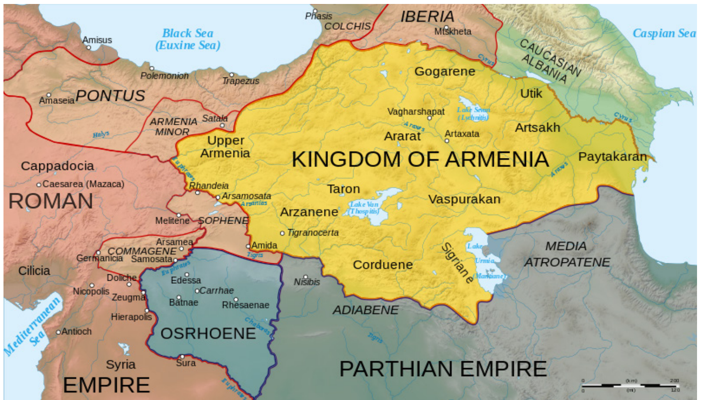
Figura 1. Situación fronteriza entre el Imperio Romano y el Imperio Parto en el siglo I. Fuente.

El primer testimonio que tenemos sobre esta historia se encuentra en la obra Historia de la Iglesia de Eusebio de Cesarea, realizada en la primera mitad del siglo IV. Según la tradición iniciada por Eusebio, Abgar sufría de una enfermedad incurable de la piel y conoció la historia de un hombre santo que estaba realizando sanaciones aparentemente imposibles en Jerusalén. El monarca de Edesa, desesperado por encontrar una cura, decidió mandarle una carta a Jesús dónde le invitaba a su ciudad para que le sanase y a su vez le ofrecía la mitad de su reino, ya que habían llegado a sus oídos que los judíos estaban conspirando contra él. Jesús recibió la carta y consideró a Abgar digno de recibir una respuesta. En ésta, Jesús rechazaba la oferta del rey ya que afirmaba que aún tenía