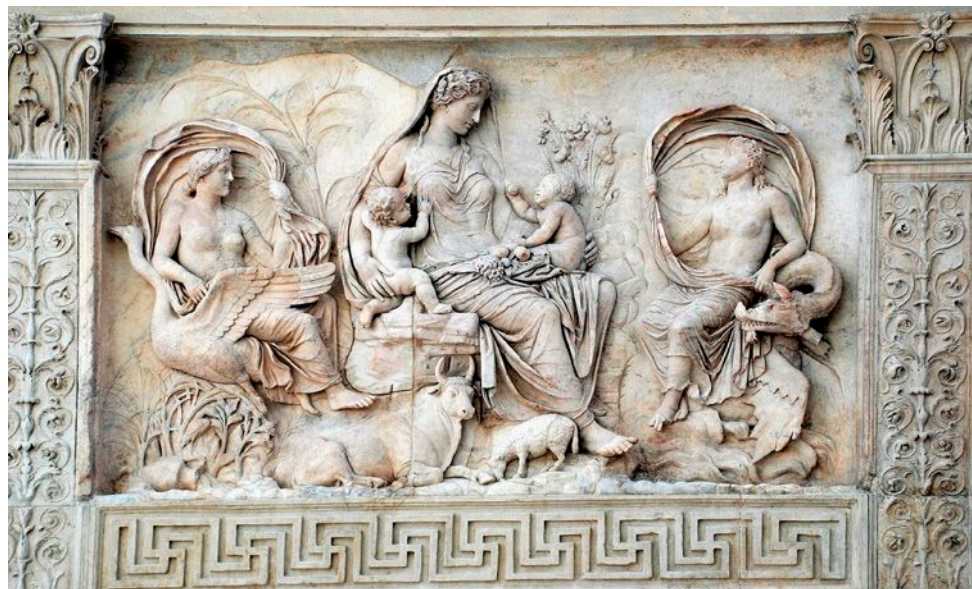
Fig. 1. Alegoría de Tellus o Tierra. Detalle del Ara Pacis , siglo I a. n. e. Museo dell' Ara Pacis (Roma).

Para un correcto estudio de las relaciones entre las personas y el medio ambiente en el que viven o vivieron resulta necesario un acercamiento al pensamiento de la época sobre esta realidad, tanto del poder dominante (leyes y normas de convivencia) como de la sociedad, a través del adecuado tratamiento de todo tipo de fuentes que hayan llegado hasta nosotros. En este punto debemos aclarar que este monográfico no se enmarca estrictamente en el ámbito de la historia de la ecología, la cual tiene una breve trayectoria, sino en el de la historia ecológica, cuyo principal objetivo es el análisis de las relaciones que las personas han establecido con el medio ambiente a lo largo de los siglos, una valoración de los comportamientos humanos con el medio en el que vivían y un estudio de las consecuencias que han tenido estas diversas actitudes. Todo ello tan solo puede llevarse a cabo partiendo de los presupuestos de la historia social.