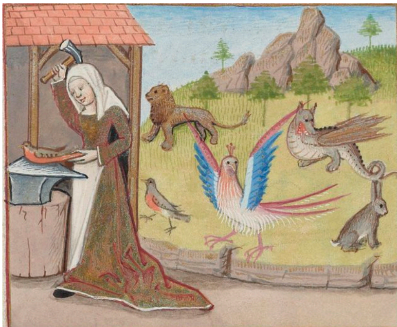
Fig. 2: Natura creando a los animales. Guillaume de Lorris y Jean de Meun, Le Roman de la Rose, c. 1490-1500. Bodleian Library, MS Douce 195, fol. 114v. Detalle.

ellas se documenta la realidad social en la que hombres y mujeres vivían: normativa jurídica (disposiciones sobre bosques, cultivos, aguas, actividades contaminantes, pureza del aire), información de carácter económico, crónicas y fuentes literarias en las que se hace alusión al paisaje, al contacto de las personas con la naturaleza, a los fenómenos naturales (catástrofes, fuegos, inundaciones, heladas, sequías). El impacto medioambiental de todos estos fenómenos no ha sido aún debidamente valorado.