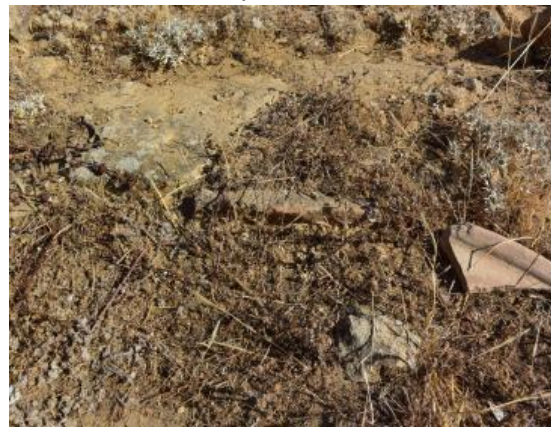
cuadrada y con una hendidura circular en el centro. En la segunda, justo en su centro, aparece una tégula romana incrustada en el suelo y resto de otra a su derecha.

Entrando al interior, a la izquierda y justo unido al lado Oeste, se vislumbra a flor de tierra una plataforma de piedra o bancada que discurre a lo largo de parte de ese lado y que probablemente sirviera de plataforma de apoyo o banco.