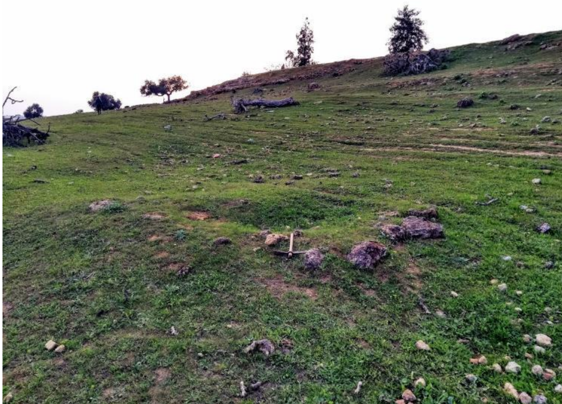
Figura 5. Observamos una estructura funeraria correspondiente a un túmulo de la Primera Edad del Hierro. En la zona central del túmulo aparece un hundimiento del terreno a modo de cráter consecuencia de haber sido excavado y expoliado en el pasado.

Sus características lo hacen similar a otros túmulos excavados por Bonsor en Los Alcores y que se incardinan en la Primera Edad del Hierro. Los mismos cubrían sepulturas de incineración o de inhumación, pudiendo ser las sepulturas individuales o múltiples. Todos se corresponden con sepulturas principescas o de una élite aristocrática.