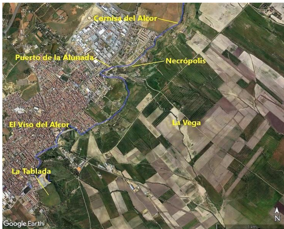
Figura 2. Fotografía satélite del área del yacimiento.