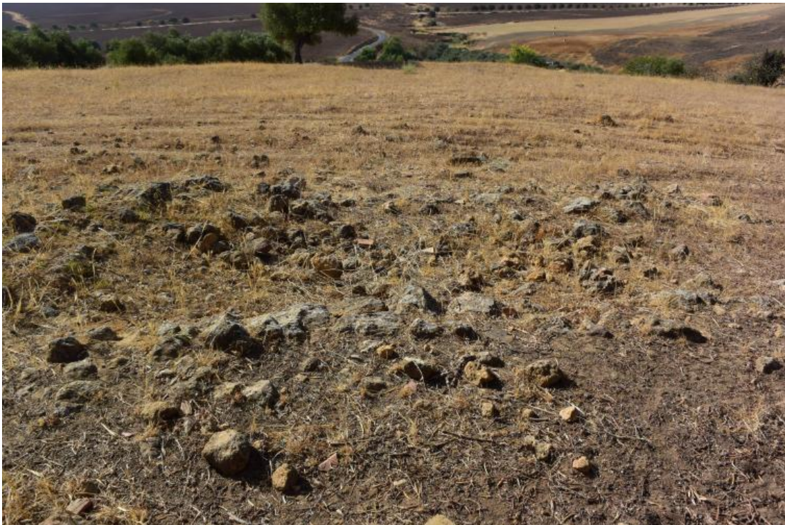
Figura 7. Se observa desde La Cornisa la planta rectangular del edificio funerario, apreciándose nítidamente parte del alzado de los muros de piedras. Al fondo, debajo, aparece La Vega.

Se ubica en la zona central de la primera terraza de la necrópolis, en la parte alta de la ladera justo al lado de La Cornisa. Tiene una forma rectangular, de forma que sus lados mayores están dispuestos paralelos a La Cornisa: su lado Norte sería el contiguo a La Cornisa y su lado Sur el que mira a La Vega.