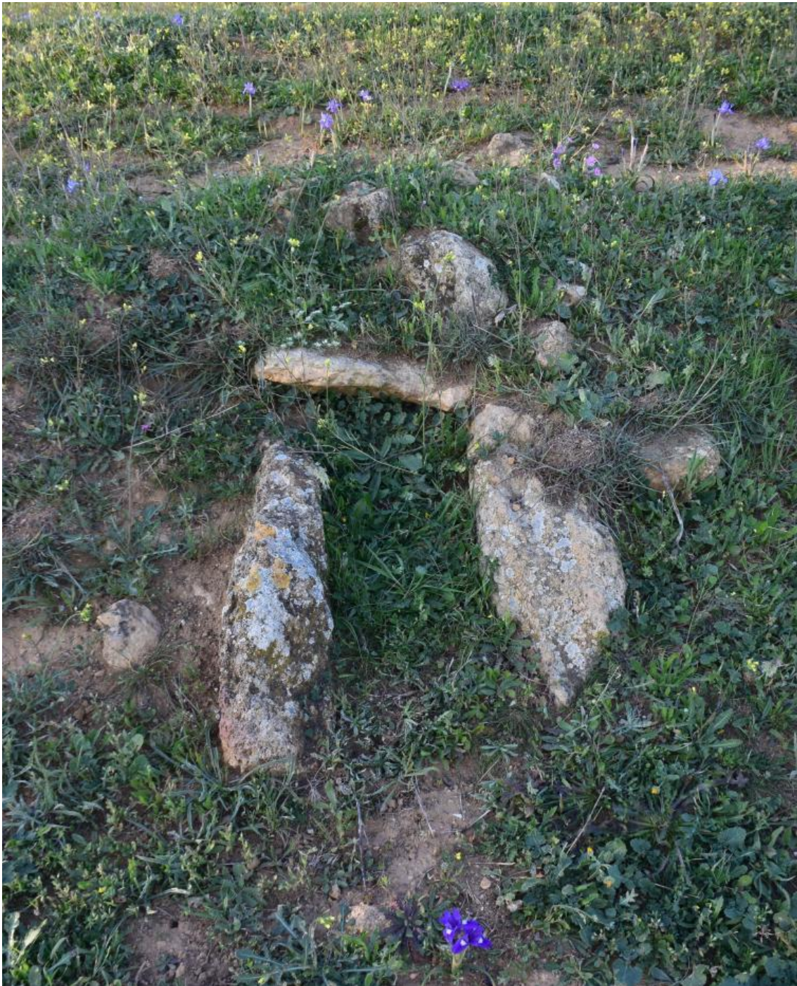
Figura 1. Se muestra una tumba protohistórica ejecutada con piedras planas.