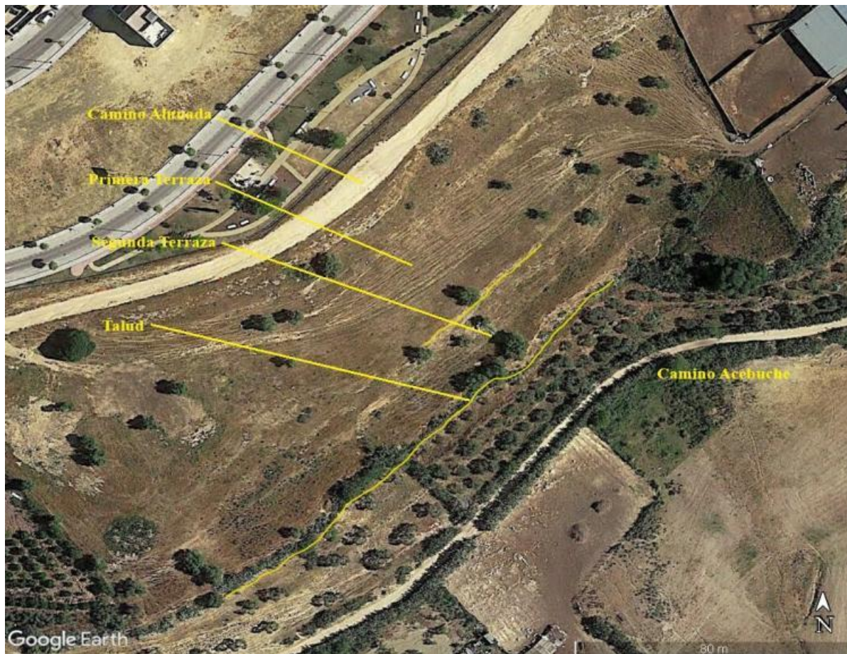
Figura 3. Vista satélite de la necrópolis.

consecuencia de haber añadido a la arcilla un desgrasante de origen mineral que tras su cocción produce dicho efecto.