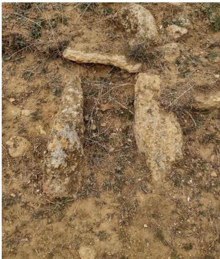
Figura 4. Se muestra en periodo estival sin la mayor parte de su corteza vegetal.

Su tipología, la disposición de las grandes piedras planas enmarcando un hueco o cavidad, se asemeja a otras tumbas de la Protohistoria, entre las que destacamos las tumbas de la necrópolis de Frigiliana en Málaga que aparecen en hoyo entibado completamente con piedras planas formando una estructura como la cista. 7 Otro paralelo se encontraría en alguna de las tumbas tartésicas de la necrópolis de La Joya en Huelva, la Tumba 3 que aparece en hoyo entibado y enmarcado con lajas de piedras 8 .