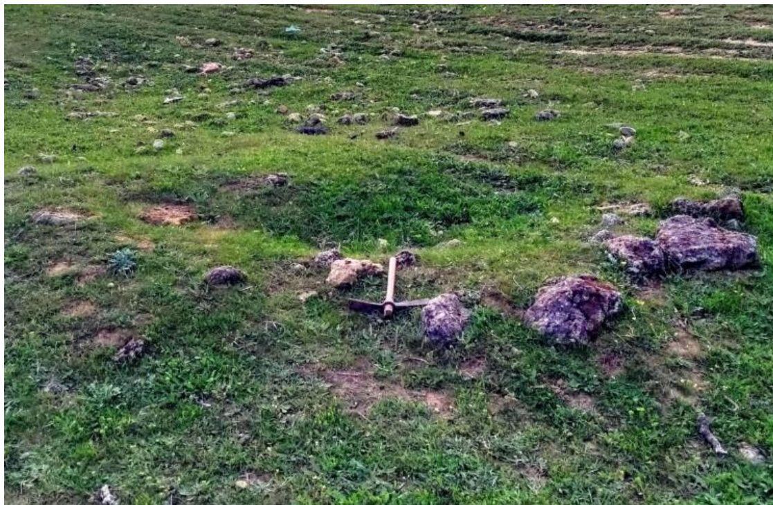
Figura 6. Se observa ampliado el cráter dejado en la cima del túmulo por la excavación realizada para su expoliación, así como los bloques de piedras planas sacados de su interior y arrojados y desplegados alrededor de dicho cráter.

Como paralelos de túmulos de inhumación en los que se utilizan piedras planas para la ejecución de la cavidad para el enterramiento, podemos citar en Los Alcores a título de ejemplo el túmulo G de El Acebuchal excavado e investigado por Bonsor y que se corresponde con una sepultura tartésica de inhumación con rico ajuar 10 .