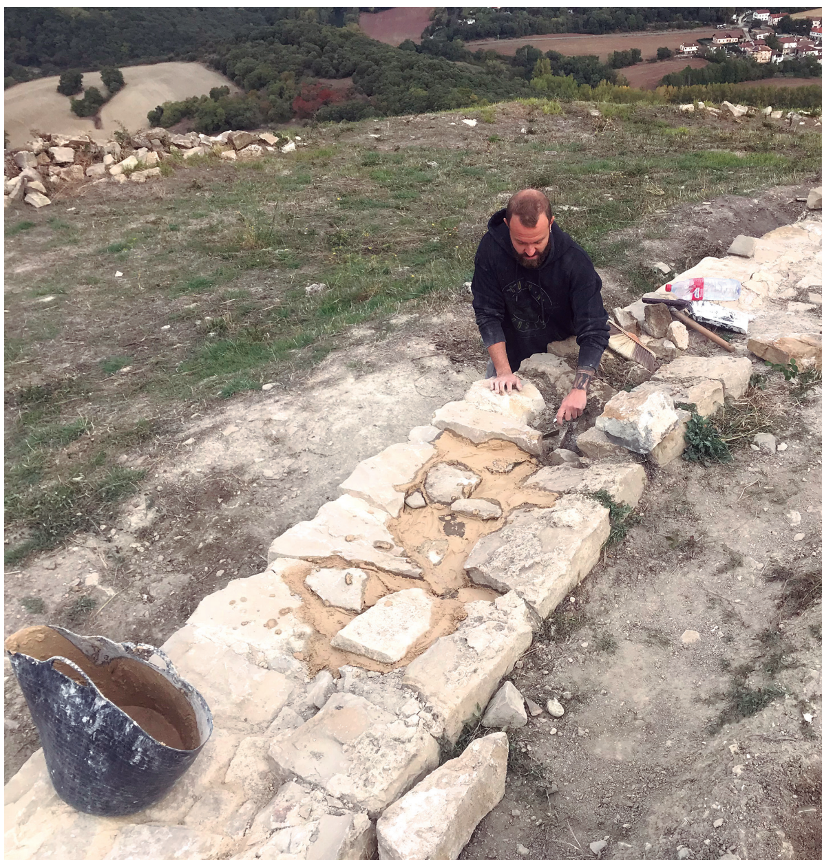
Figura 12. Proceso de consolidación.

forma piedras y restos de gravas, para facilitar el crecimiento de manto vegetal herbáceo, objetivo que se ha conseguido en gran parte del castillo al retirar las piedras que permiten el crecimiento de zarzas y dejar un crecimiento de hierba que permite limpiezas sencillas cada primavera.