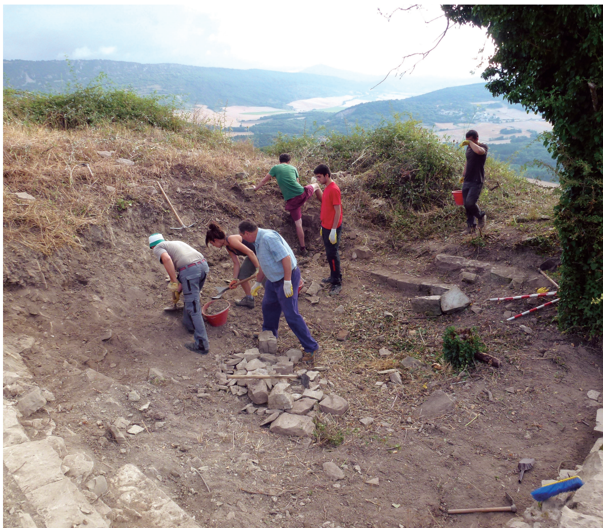
Figura 3. Labores de limpieza en el aljibe en el año 2013.

En el año 2013 comenzó su excavación. Fue un trabajo no exento de esfuerzo para desplazar la tierra y piedras de forma manual a un punto externo. Pronto comenzó a encontrarse el cierre con un paramento en buen estado, salvo en la zona más expuesta y próxima a los árboles. Aquí las piedras de sillería no se encontraban y sólo fue visible el relleno del muro de cierre.