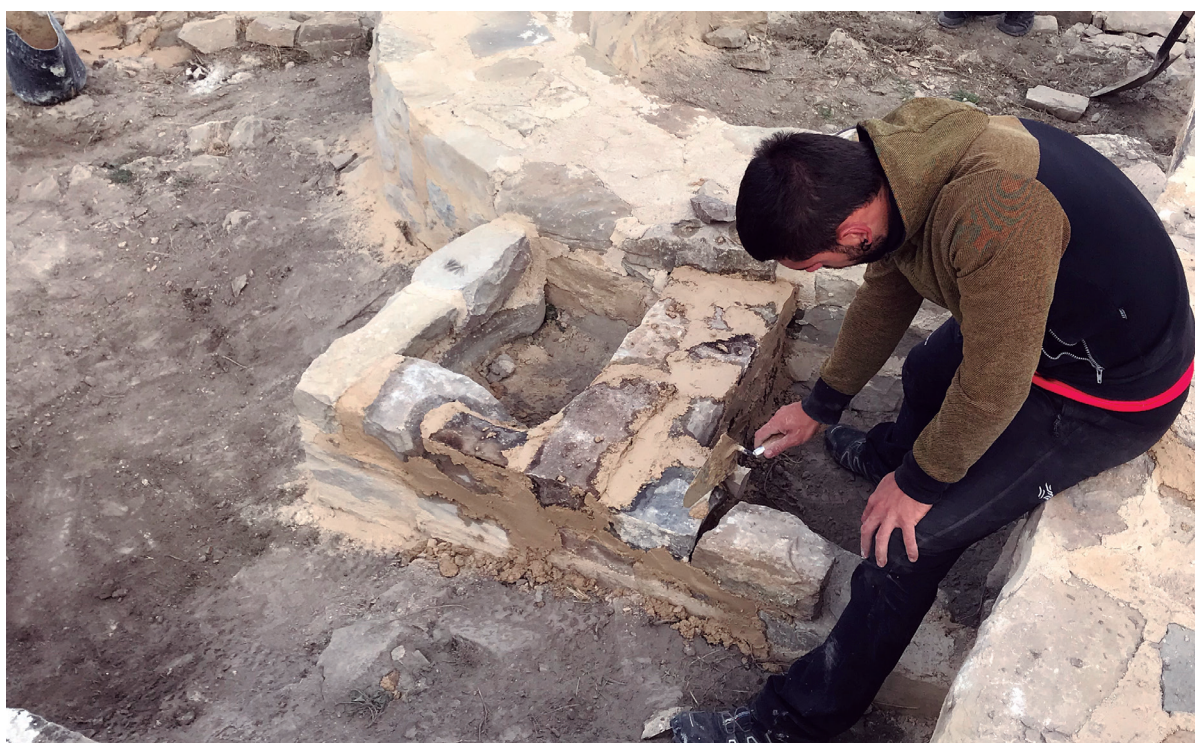
Figuras 13 y 14. Proceso de consolidación.