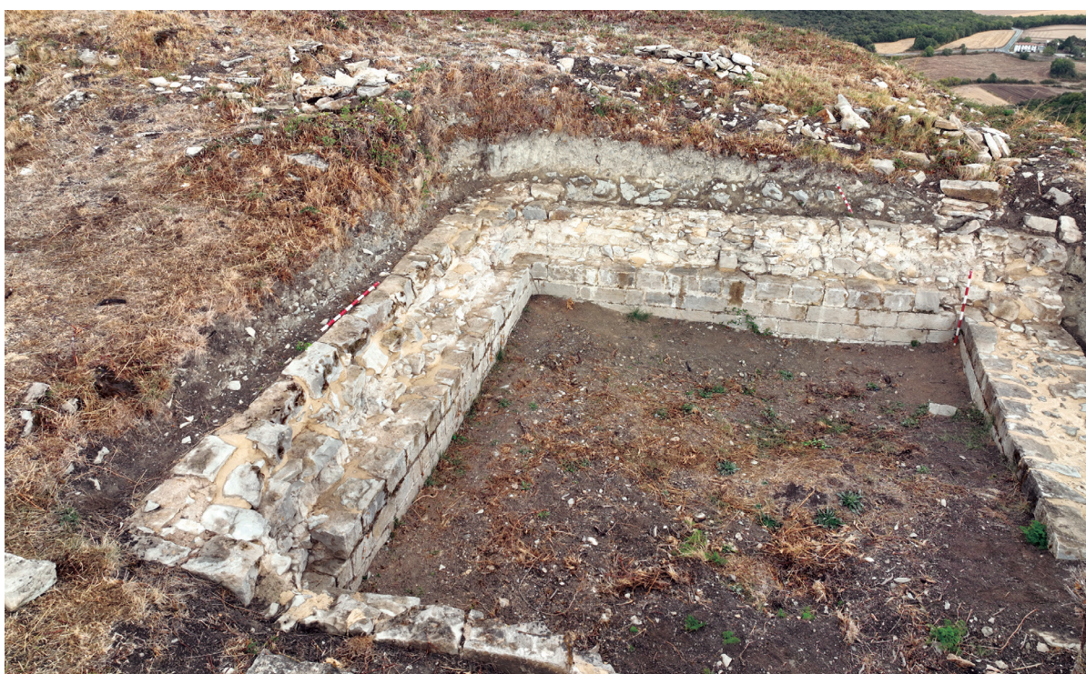
Figuras 4 y 5. El aljibe antes de su consolidación y con sus estructuras visibles consolidadas.