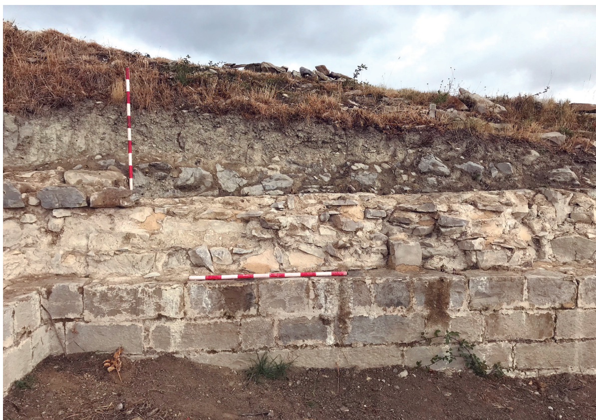
Figura 8. En detalle muros consolidados.

Los trabajos se han cumplimentado en las dos semanas propuestas en el proyecto. Se ha incrementado con más estudios y consolidación de algunas zonas que presentaremos.