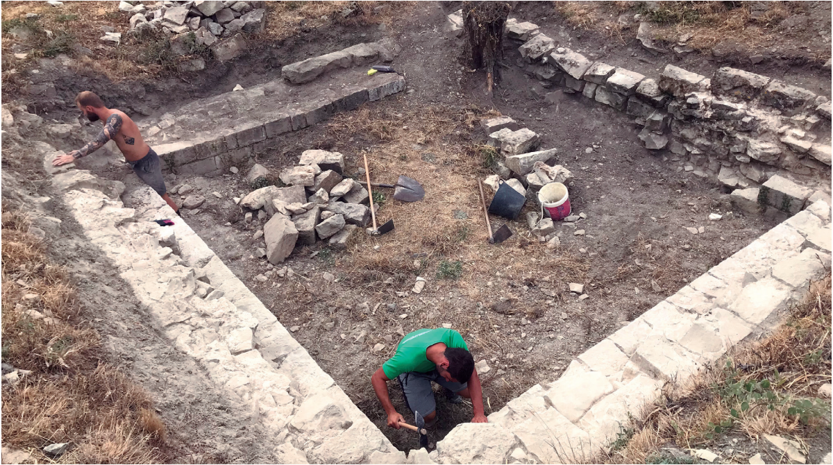
Figura 6. Proceso de consolidación.