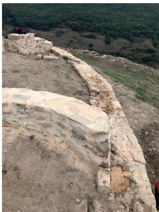
Figuras 15, 16 y 17. Proceso de consolidación.