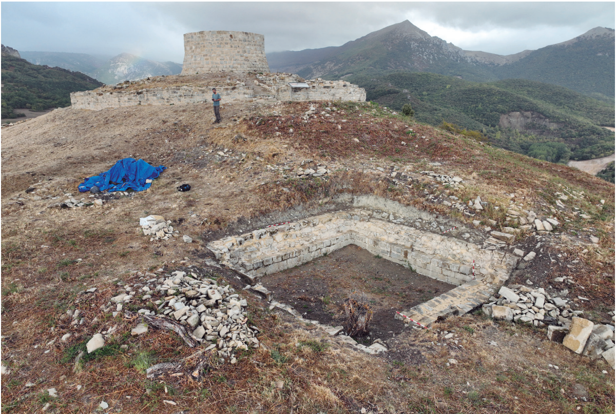
Figura 1. Presentamos en este artículo los trabajos de consolidación del aljibe y otras estructuras en el castillo de Garaño. El interés de este trabajo continuado es la investigación y puesta en valor.

1. INTRODUCCIÓN. 2. EL ALJIBE. 3. ESTUDIO DEL ALJIBE. 4. OTROS ELEMENTOS CONSOLIDADOS.