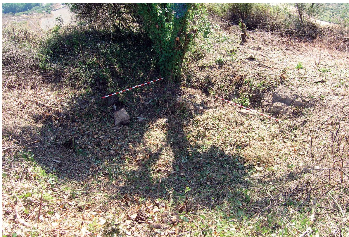
Figura 2. Aljibe antes de comenzar los trabajos. Apenas se vislumbraban dos piedras.

Se sitúa al sureste del recinto, orientado en la parte más protegida y a un nivel inferior, coordenadas UTM: X: 596.486, Y: 4.745,415. En el estudio inicial se percibía un hueco, sin piedras, con abundante vegetación como se aprecia en la imagen.