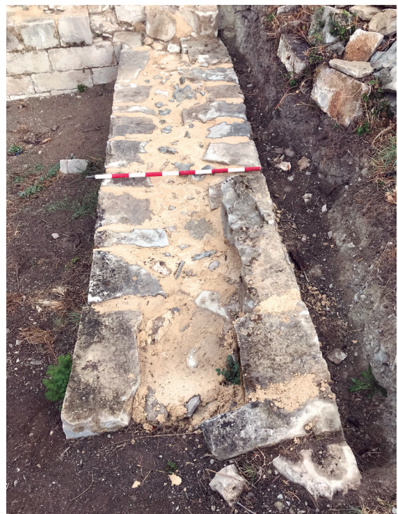
Figuras 10 y 11. Proceso de consolidación del muro este. Tras el proceso de limpieza inicial y su restauración definitiva.