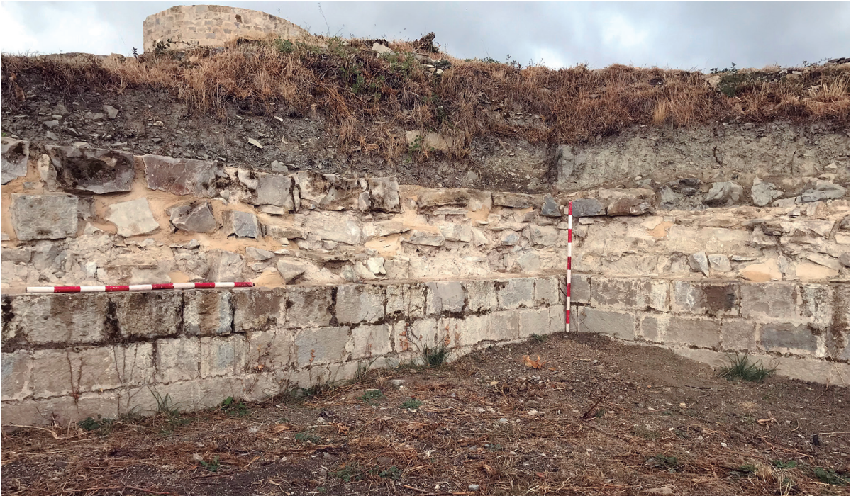
Figura 9. En detalle muros consolidados.