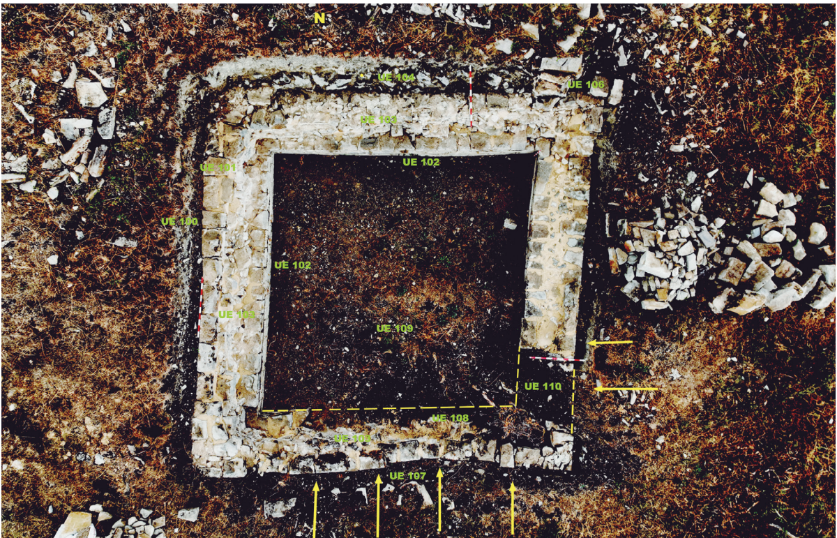
Figura 7. UE asignadas al aljibe. Flechas de presión del terreno.