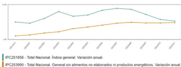
Variación anual del IPC general y la inflación subyacente