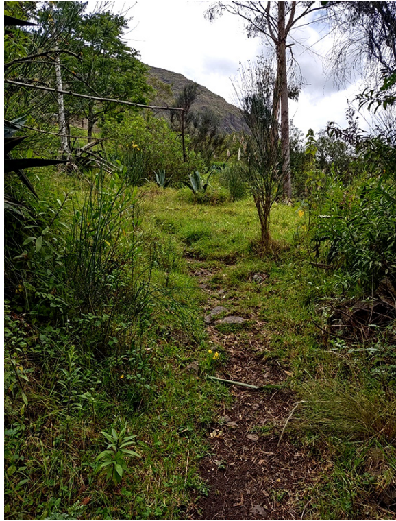
Foto 4. FRAGMENTO DEL ANTIGUO CAMINO A SAN BARTOLOMÉ, EN PAMAR-CHACRÍN.

relación de antiguos senderos con las actividades comunitarias puede establecerse en que estas funcionan en detrimento de las antiguas rutas, al abrir y ensanchar vías nuevas; por otro lado, hay ciertas actividades que requieren del uso de las mismas sin que esta actividad represente su pérdida. Tal es el caso de un joven que tras realizar labores comunitarias en el cerro Fasayñán , resultó extraviado (El Comercio, 2012, 20 de junio), como sabemos, el acceso al cerro consta de un sendero tradicionalmente utilizado desde hace decenas de años atrás por diferentes situaciones, entrelazándose con las actividades comunitarias que incluso pueden unirse para el mantenimiento de dichos caminos, sobre todo si estos tienen un contexto arqueológico como lo son ciertos ramales del denominado Qhapaq Ñan .