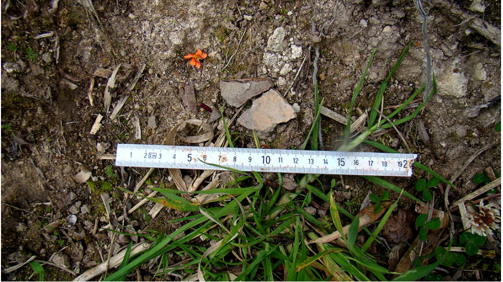
Foto 2. FRAGMENTOS CERÁMICOS HALLADOS EN EL CERRO ZHIMAZHUMA EN LA PARROQUIA JIMA.

Finalmente, tenemos otro ritual muy importante dentro de la cosmología andina, que difiere una vez más de las creencias modernas de espiritualidad, puesto que se trata de una celebración arraigada y estructurada dentro de la idiosincrasia rural de la región, que son las fiestas equinocciales como el Cápac Raymi o el Inti Raymi . La importante población kichwa del cantón Sígsgig sigue llevando a cabo esta práctica precolombina, la cual, nuevamente, involucra el uso de caminos antiguos, como lo es en las ocasiones que el rito se celebra en el complejo arqueológico de Chobshi (Pérez, 2021), en el cual consta un camino antiguo que conecta ciertas zonas de interés como las comunidades de Nárig o Tricos. Si bien, este ritual se enmarca dentro de la tradición andina, al tener en cuenta que ninguna actividad humana puede encasillarse, festividades como el Inti Raymi también son foco de interés para las personas ajenas a la tradición en busca de nuevas espiritualidades (ver foto 3) y ayudan al investigador a trazar cronologías y paralelismos entre lo monumental y lo inmaterial.