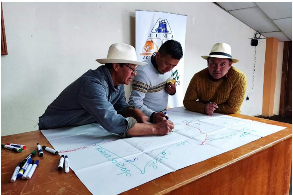
FOTO 5. MIEMBROS DEL GADP DE JIMA PARTICIPAN EN UN TALLER DE CARTOGRAFÍA SOCIAL.

La influencia de la política dentro de los caminos antiguos dista de ser algo concreto (ver foto 5), sino más bien se aplica en ciertos casos. Que un GAD o Ministerio empleen una estrategia de conservación de patrimonio, no asegura que en esta se incluya al camino antiguo, el cual es apenas contextualizado dentro del discurso político, como podemos ver en las noticias de El Mercurio, en este caso sobre el diseño de rutas turísticas, (2007) donde se referencia al Qhapaq Ñan , restando importancia a los caminos locales. La realidad del camino antiguo en relación a la gestión política es muy indirecta y unilateral, ya que las instituciones son responsables en varios aspectos de la permanencia o desaparición de tales rutas, esta actúa indirectamente al momento de decidir su futuro. Claro, la vialidad moderna no debe ser satanizada, ni los caminos antiguos endiosados, cada sistema cumple su función, sin embargo, es importante mantener una memoria, y para efectos prácticos, un ejemplo material que ayude a establecer vínculos con nuestro propio modus vivendi .