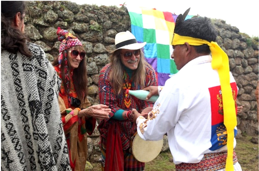
Foto 3. TURISTAS DEL EXTRANJERO PARTICIPARON DE LA CEREMONIA EN CHOBSHI.

es así, sino porque los usos actuales los dotan de nuevas dinámicas que poco o nada tienen que ver con las motivaciones de este estudio. La mayor parte de las vías que conectan las comunidades del cantón Sígsig son ahora mínimamente transitables con un automotor, salvando, claro está, algunas que se han visto sustituidas o relegadas, y de ahí deviene la problemática entre si las labores comunitarias y laborales en el cantón han de constar como otra categoría de uso actual de los caminos antiguos. La respuesta es, a breves rasgos, afirmativa. Los habitantes del cantón conservan aún relaciones de carácter laboral con el camino, que se extienden generacionalmente hacia tiempos remotos.