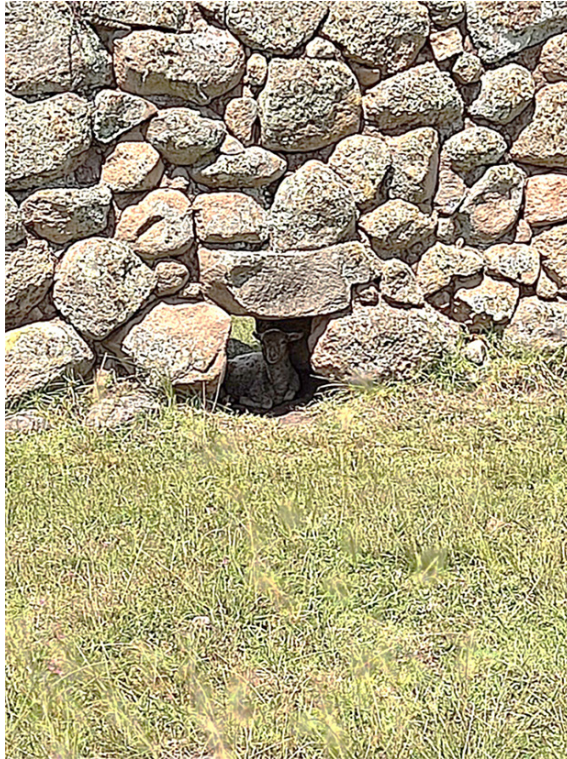
Foto 6. CORDERO DESCANSA BAJO UNA ESTRUCTURA EN INGAPIRCA DE CHOBSHI.

turístico tiene una enorme amplitud y se acopla a un sinfín de actividades independientes unas de otras, por lo que se puede decir que se genera un aislamiento entre actividades. En Sigsig tenemos por un lado el complejo arqueológico de Chobshi, que es con toda seguridad el punto focal de atracción turística (ver foto 6), en tanto el resto del cantón no cuenta con esta relevancia tan marcada, las actividades recreativas se encuentran bastante diseminadas e incomunicadas las unas de las otras: San Bartolomé con la Ruta de las Guitarras, Güel como punto de peregrinación al cerro Fasayñán (Astudillo, 2018) o Jima en el paso al Oriente, con lo que el cantón tiene mucho que ofrecer, pero poca expansión mediática quizá.