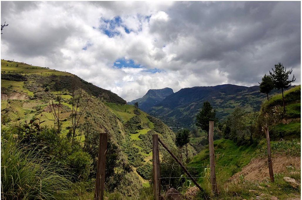
FOTO 1. VISTA DEL CERRO FASAYÑÁN DESDE LA PARROQUIA GÜEL, SITIO PREDILECTO PARA LOS MONTAÑISTAS.

Finalmente, dentro del ámbito deportivo destaca lo que son las carreras de campo travesía, o trail , del cual se realizan recorridos de montaña cada cierto tiempo. Esta actividad es de un alcance más modesto, dado el número de participantes puntuales que existen, por razones como el significativo esfuerzo físico que representa el recorrido al trote por sinuosos caminos de montaña, que atraviesan fuentes de agua y discurren por determinadas rutas conocidas por los lugareños. La página de Joanllapa Producciones (2021), nuevamente pone al tanto diversas pruebas atléticas, entre las cuales destaca la llamada “Los guerreros del trail”, donde los aficionados a las pruebas de campo travesía realizan recorridos de entre 15 a 25 km dentro del cantón, donde muchos de estos caminos tenían pretéritos usos laborales, que conducen a comunidades y lugares montanos, todo ello en estímulo de la labor física y la competencia.