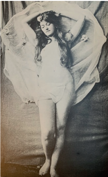
IMAGEN 4. Ovenden y Mendes, Victorian erotic photography (1973: 28).

A diferencia de los anteriores, la imagen del texto procede directamente de alguna de las paleofotos del libro Victorian erotic photography (1973) de Graham Ovenden y Peter Mendes, comprado por Luis Alberto de Cuenca durante una visita a Londres en la década de 1970. Echando un vistazo, la descripción inicial de la joven rubia (vv. 1-6) podría estar modelada sobre algún retrato concreto del libro, especialmente ciertas fotos de aire clásico (ver imagen 4) o prerrafaelita (imágenes 5-6), pero no se aprecian bien los detalles indicados en el poema (pelo rubio, ojos azules) por el formato en blanco y negro, y ninguna de las fotos coloreadas (como la imagen 7) responde al erotismo del desnudo que también se evoca (“cuerpo de diosa”):