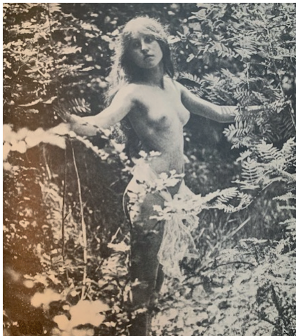
IMAGEN 6. Ovenden y Mendes, Victorian erotic photography (1973: 59).