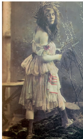
IMAGEN 7. Ovenden y Mendes, Victorian erotic photography (1973: 77).

Por eso, quizá pueda tenerse por mejor una recomposición a distancia de varias imágenes a partir del recuerdo, que se entrecruza con otros referentes artísticos. Téngase en cuenta con Eco (2013 [2000]: 209) que hay también un tipo de écfrosis oculta que se configura como un “dispositivo verbale che vuole evocare nella mente di chi legge una visione, quanto più possibile precisa”, que, además, puede jugar –como es el caso– con los límites de la descripción imaginaria (o simplemente recordada).