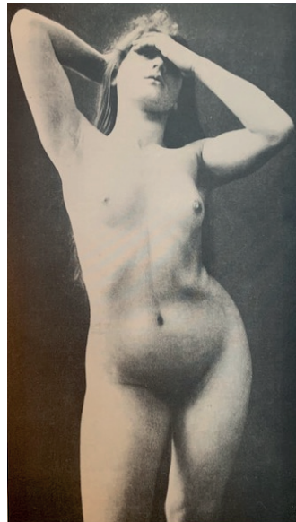
IMAGEN 5. Ovenden y Mendes, Victorian erotic photography (1973: 55).