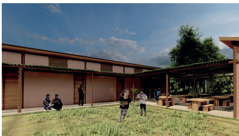
Figura 5. Proposta B - Projeto.