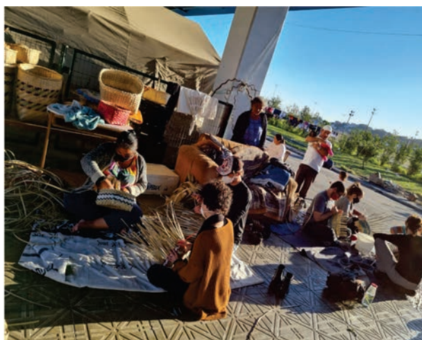
Figura 2. Resultados da primeira visita.