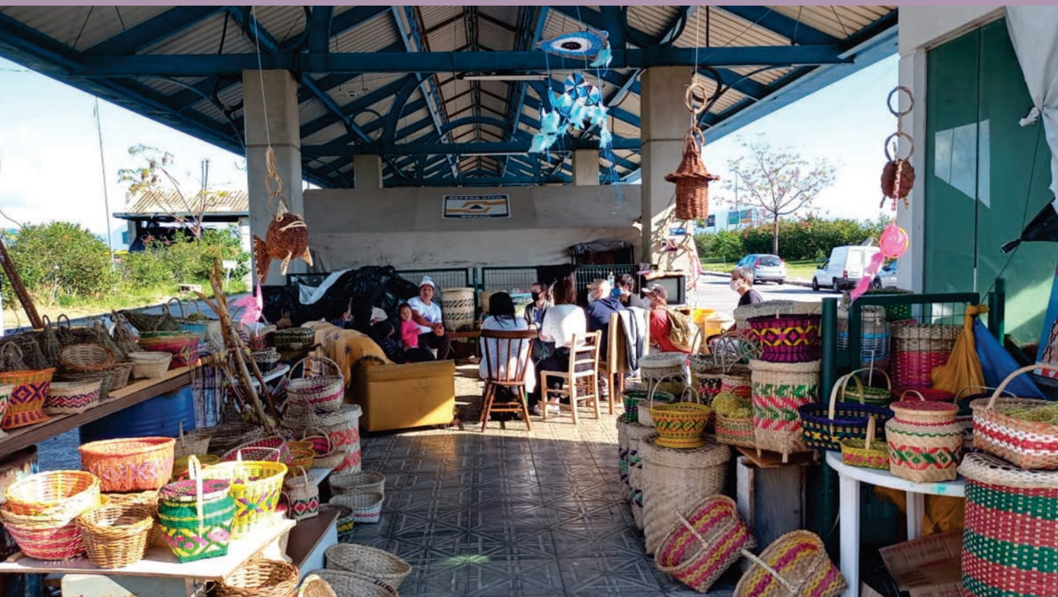
Figura 0. Resultados da primeira visita.

CASA DE PASAJE INDÍGENA EN FLORIANÓPOLIS: PROYECTO PARTICIPATIVO Y ACCIONES DEL ESTADO