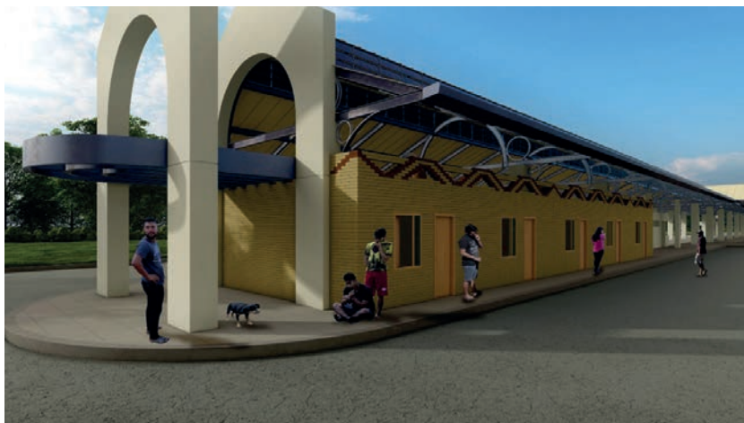
Figura 8. Proposta C - Perspectiva.