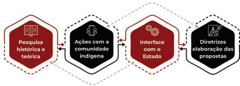
Figura 1. Etapas da pesquisa.

das pessoas que a irão utilizar: Unwin (2013) aprofunda o tema argumentando sobre o protagonismo e o envolvimento do usuário na definição do desenho arquitetônico, o que possibilita projetar lugares identificáveis.