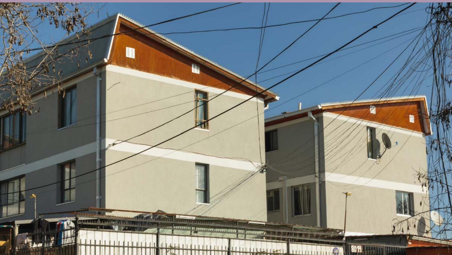
Figura 0. Prototipo H-56 (Grupo GAMA). Población Laguna Poniente.

ZONA DE OPERAÇÃO. O HIBRIDISMO TÁTICO DA EXPOSIÇÃO DEMONSTRATIVA SANTIAGO AMENGUAL EM PUDAHUEL