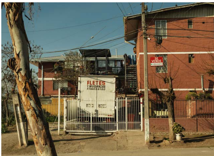
Figura 4. Prototipo Casa Superpuesta de Tres Pisos. Empresa SOCOANTO (arquitectos Neira, Novoa, San Martín). Exposición Demostrativa Santiago Amengual.

Estas viviendas, que estaban destinadas para “el hombre común, de menores ingresos, [que] es un adquirente sui generis en el mercado de la vivienda” (MINVU, 1976a, p. 13), consideraban los siguientes tipos: social, con una superficie edificada comprendida entre los 35 y 45 metros cuadrados, y la de cooperativas, cuya superficie oscilaba entre 35 y 60 metros cuadrados (MINVU, 1976b, p. 2).