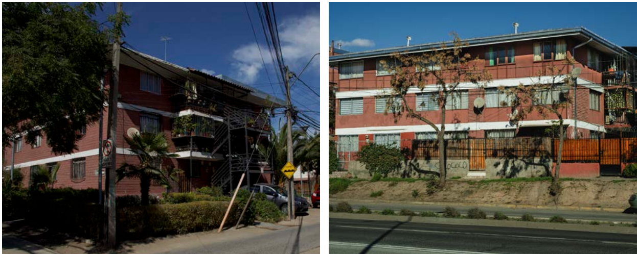
Figura 5. Tipología MINVU 3503. Exposición Demostrativa Santiago Amengual.

la Exposición Demostrativa Santiago Amengual se encuentra que se seleccionaron 128 tipologías de vivienda, aunque el paño de terreno estaba dividido en 240 sitios. De estas soluciones, 118 correspondían a tipologías de baja altura (casas), la mayoría de ellas pareadas, mientras que los restantes 10 casos correspondieron a tipologías de vivienda colectiva en altura de 3 o 4 pisos, en las que se incluyeron los colectivos CORVI 3502 y 3503 de tres pisos (Figura 5), y 7 tipologías de vivienda que proveían de 24 soluciones de vivienda.