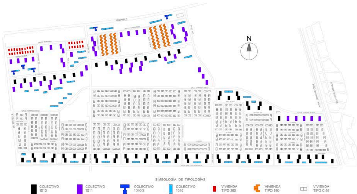
Figura 2. Plano General de la Población Santiago Amengual en Pudahuel considerando la propuesta de densificación.

modo de tejer socialmente su realidad a partir de la hibridez y el sentido táctico de sus diseños (Barrientos-Díaz & Nieto-Fernández, 2021).