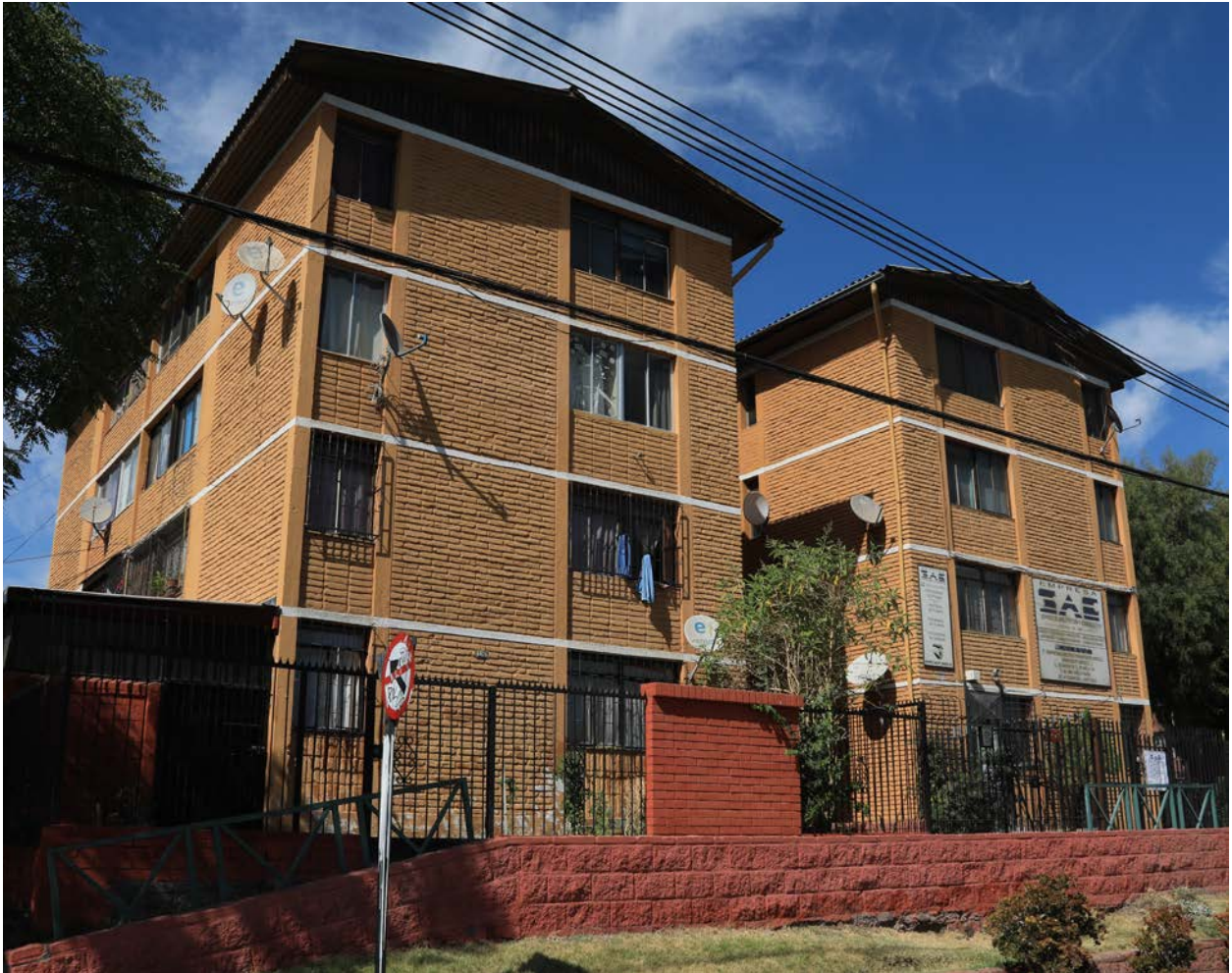
Figura 6. Prototipo H-56 (Grupo GAMA). Exposición Demostrativa Santiago Amengual.