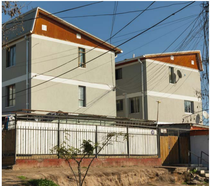
Figura 7. Prototipo H-56 (Grupo GAMA). Población Laguna Poniente.