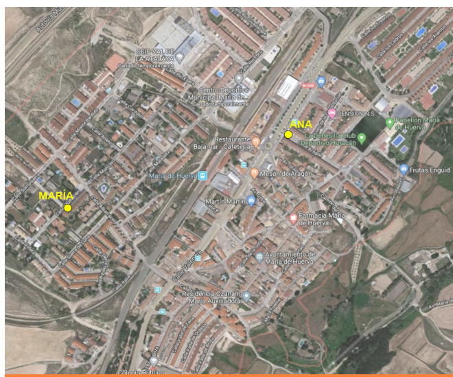
Ilustración 1: ¿Dónde podrán quedar estas dos amigas?

A modo de ejemplo que ilustre al mismo tiempo la construcción de conocimiento a través de la resolución de problemas y la atención a la diversidad desde un enfoque inclusivo, comentaremos una implementación de una actividad para introducir la mediatriz, la cual describe Arnal-Bailera (2013). La tarea, en lugar de comenzar explícitamente dando una definición de mediatriz, empieza dando un mapa en Geogebra y pidiendo al alumnado a colocar 5 o 6 puntos en el mapa que estén a la misma distancia de dos amigas (Ilustración 1). Es una tarea muy accesible que implica colocar un punto, medir distancias, observar y reflexionar. A pesar de que la actividad está pensada para primeros cursos de Educación Secundaria, podría plantearse en Educación Primaria, puesto que el “suelo” parte de ahí. Posteriormente, el andamiaje que se sucede en forma de preguntas incidirá en qué figura se forma al unir esos puntos, en cuántos puntos son necesarios para encontrar todos, si fueran tres amigas qué pasaría, etc.