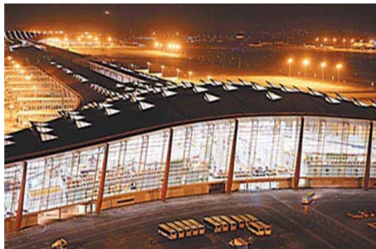
Dragón (Aeropuerto Internacional de Beijing, China) http://english.people.com.cn/90001/90776/90882/6448275.html