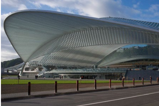
Estación de Alta Velocidad Ferroviaria de Lieja-Gillemins, 2009 https://www.dezeen.com/2009/12/02/liege-guillemins-station-by-santiago-calatrava/