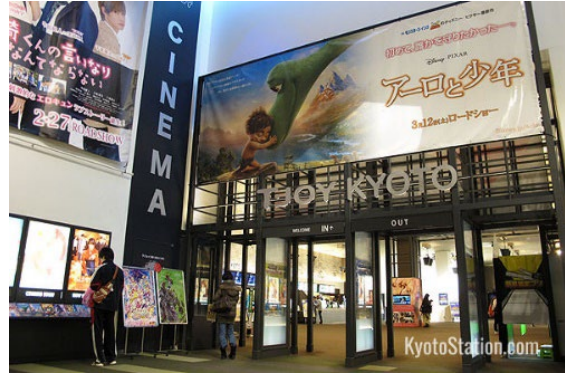
Cine y teatro en la estación ferroviaria de Kyoto, Japón https://www.kyotostation.com/aeon-mall-kyoto/