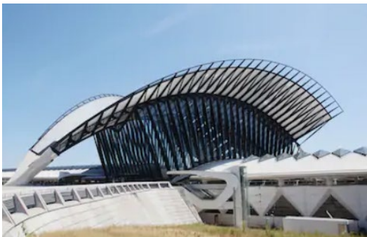
Estación de Alta Velocidad Ferroviaria de Lyon-Saint Exupéry, 1994