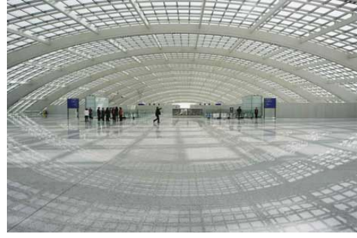
Terminal 3 del Aeropuerto Beijing Internacional, 2008 http://www.brisbanetimes.com.au/news/travel/beijing-opens-27b-terminal/2008/02/29/1204226971512.html