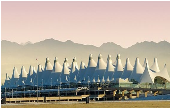
Montañas Rocosas (Aeropuerto Internacional de Denver, Estados Unidos) http://www.slobertson.com/galleries/usa/colorado/htm