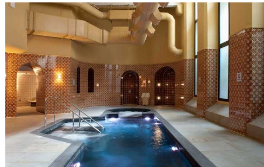
Spa en la estación ferroviaria de St. Pancras-Londres, Reino Unido https://www.treatwell.co.uk/place/st-pancras-spa-at-renaissance-london-hotel/