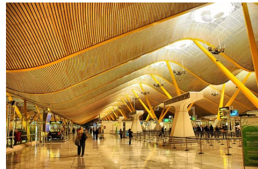
Terminal 4 del Aeropuerto A.S. Madrid-Barajas, 2006 http://www.republica.com/2013/05/22/aena-apuesta-por-una-nueva-linea-de-lujo-_654131/