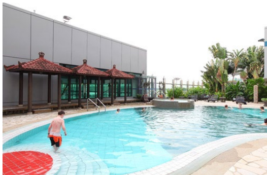
Piscina en el Aeropuerto Internacional de Singapur Changi http://gianmarcolemura.tumblr.com/page/2