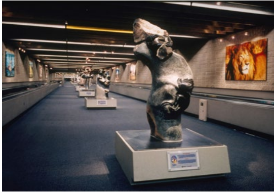
Galería de Arte en el Aeropuerto Internacional de Atlanta-Hartsfield, Estados Unidos http://www.atlanta-airport.com/HJN/2009/08/passenger1.htm