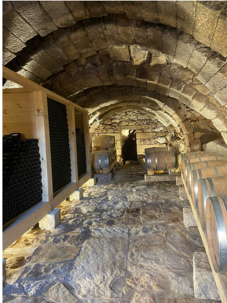
Figura 3. Restauración de una bodega histórica para uso comercial