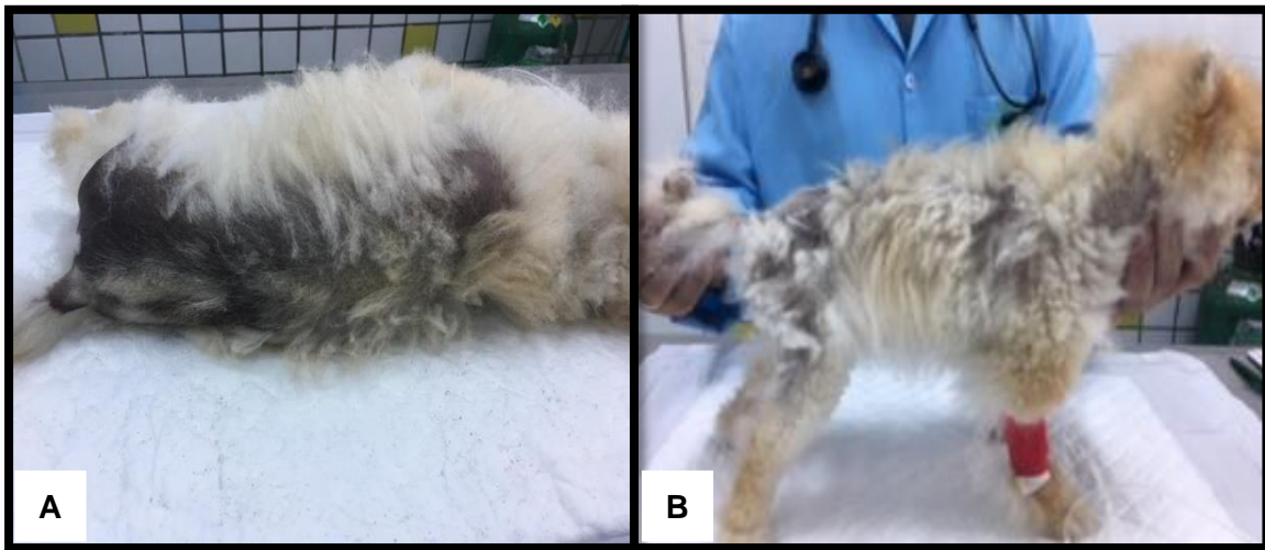
Figura 1 – Primeiro paciente antes da realização do microagulhamento. Presença de alopecia e melanodermia na região dorso ventral (A) e região lateral do tórax (B).

Dois pacientes caninos, machos, da raça Spitz Alemão, castrados, 2 e 5 anos de idade, respectivamente, foram atendidos na clínica Pronto Pet entre junho e dezembro de 2017, apresentando como queixa principal um quadro de alopecia simétrica bilateral na região de dorso e flanco, poupando cabeça e membros, além de melanodermia na região cervical ventral e dorsal, caudal e perianal (Figura 1 e 2).