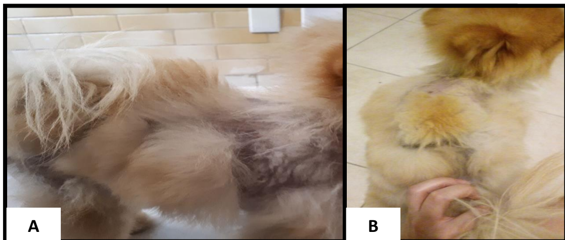
Figura 5 – Segundo paciente com repilação em mais de 50% do corpo 90 dias após procedimento de microagulhamento. Vista lateral (A) e vista dorsal (B).