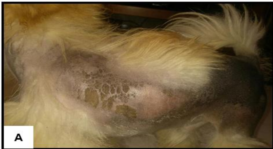
Figura 3 - Crostas nas regiões alopécicas, sem sinais de infecção 7 dias após microagulhamento (A).

alopécicas, entretanto não mostrando sinais de infecção (Figura 3). O uso semanal do shampoo a base de clorexidine 3% foi mantido até a data de retorno para reavaliação.