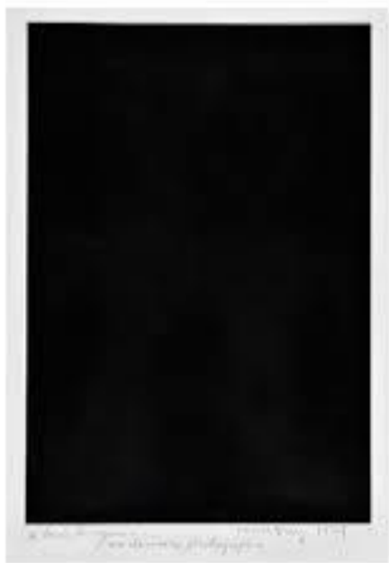
Figura 1. Ma dernière photographie (Mi última fotografía), Man Ray, 1929.