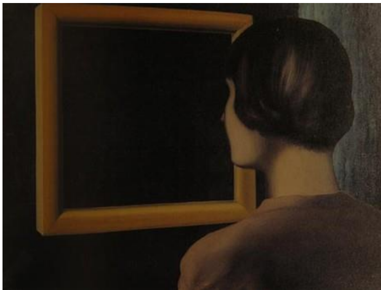
Figura 2. L'Image parfaite (La imagen perfecta, René Magritte, 1928)