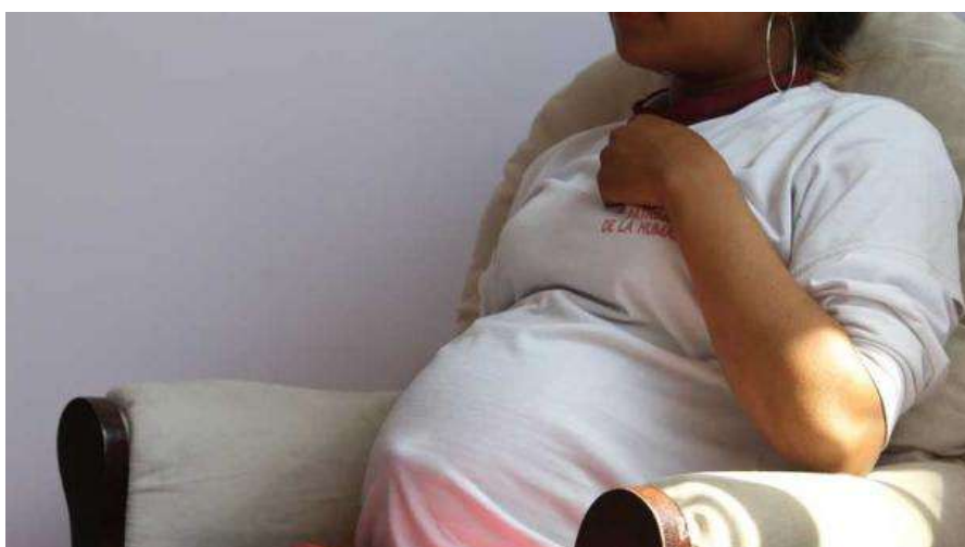
Figura 1 En los últimos 10 años, el incremento de partos de adolescentes de entre 10 y 14 años fue del 78% en Ecuador.

Los jóvenes son muy vulnerables y requieren atención, porque en este lapso ellos entran en crisis de rebeldía por el cambio hormonal que atraviesan y es justo en este proceso donde se forma el sujeto y se solidifica el comportamiento, (Camargo y Plasencia, 2017), la adolescencia es uno de los periodos por el que todos los seres humanos pasan el cual está vinculado con el crecimiento físico, emocional, y hormonal. La pubertad se convierte en el desarrollo que permite el comienzo de la toma de decisiones conscientes.