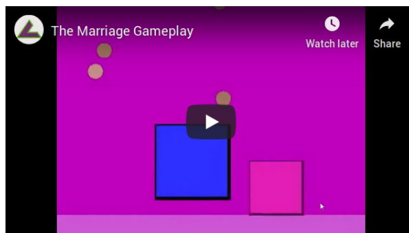
Fig. 1: Gameplay The Marriage