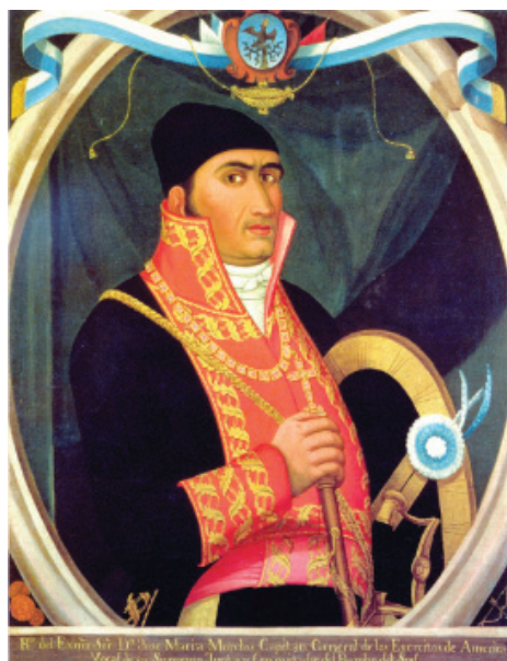
Retrato del Excelentísimo Señor Don José María Morelos. Capitán General de los Ejércitos de América. Vocal de su Suprema Junta y Conquistador del Rumbo del Sur. Anónimo indígena oaxaqueño, óleo/tela, 82 x 69 cm. Fuente: Museo Nacional de Historia Castillo de Chapultepec.

Desde el Palacio Nacional en Puruarán (Michoacán) el Soberano Congreso expidió el Decreto del 3 de julio de 1815 con el que se fijaba el Gran Sello de la Nación reformando el realizado en 1811 como Primer Escudo y Sello oficial de la Suprema Junta.