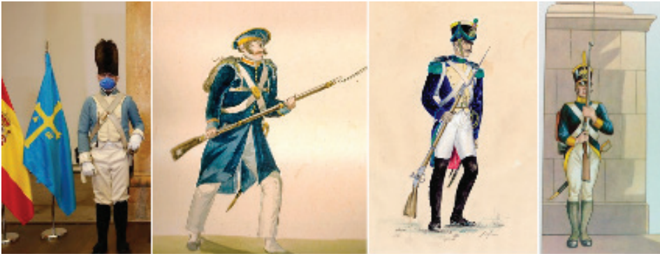
FIGURAS 15, 16, 17, 18

Soldado realista en la Conmemoración del 25 de mayo de 1808. ARHCA Asociación de Recreación Histórico Cultural de Asturias http://www.arhca.es/v1/arhca_inicio.htm . Fuente: "Asturias necesita hoy rebelión, confianza y audacia", proclama Barbón ante el nuevo giro industrial "que solo puede ser verde y digital". ARDURA, J.A., La Nueva España . Oviedo (25/05/2021) https://www.lne.es/asturias/2021/05/25/asturias-necesita-hoy-rebelion-confianza-52232766.html ; Soldado asturiano del Ejército Realista. Acuarela de Theubet de Beauchamp. Fuente: https://es.wikipedia.org/wiki/Archivo:Soldado_asturiano_del_Ej%C3%A9rcito_Realista_Acuarela_de_Theubet_de_Beauchamp.jpg . Soldado realista Real Regimiento Talavera de la Reina (1810-1814) Francisco Leiva Mella. Fuente: https://www.museoyerbasmilitares.gov.cl/638/w3-article-51310.html?_noredirect=1 . Soldado trigarante, Historia Gráfica del Ejército Trigarante. Carlos D. Neve. http://miniaturasmilitaresalfonscanovas.blogspot.com/2015/01/historia-grafica-del-ejercito-mexicano.html