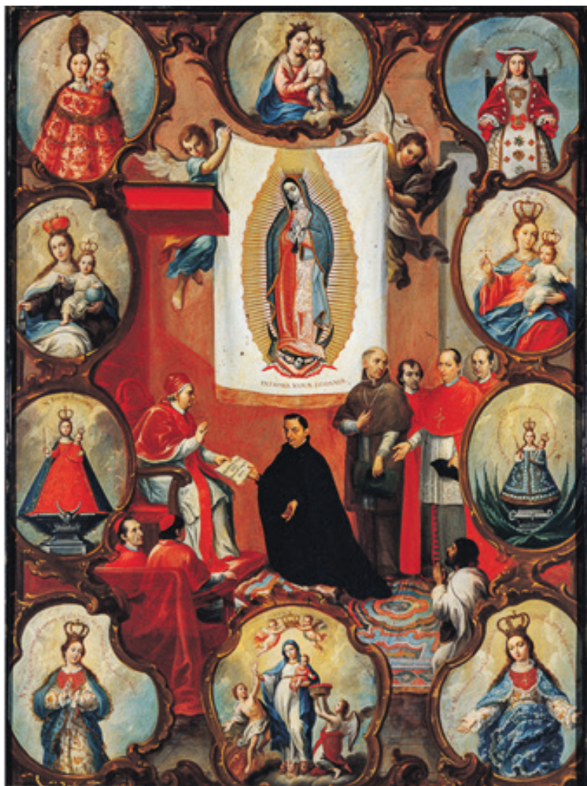
Miguel Cabrera (atribución) La proclamación pontificia del patronato de la Virgen de Guadalupe sobre el reino de la Nueva España, ca. 1756, óleo sobre lámina de cobre, 58x42.5 cm. Colección Museo Soumaya. Fundación Carlos Slim, A.C / Ciudad de México. https://artsandculture.google.com/asset/la-proclamaci%C3%B3n-pontificia-del-patronato-de-la-virgen-de-guadalupe-sobre-el-reino-de-nueva-espa%C3%B1a-miguel-cabrera-atribuido/1QGJKJWuoagkPQ