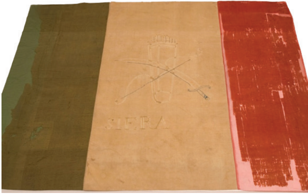
Bandera Siera (Sierra), paño de lana verde y tela de lino blanca y roja (1812-1817). Fuente: Museo Nacional de Historia Castillo de Chapultepec, Ciudad de México.