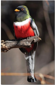
FIGURAS 4 Y 5