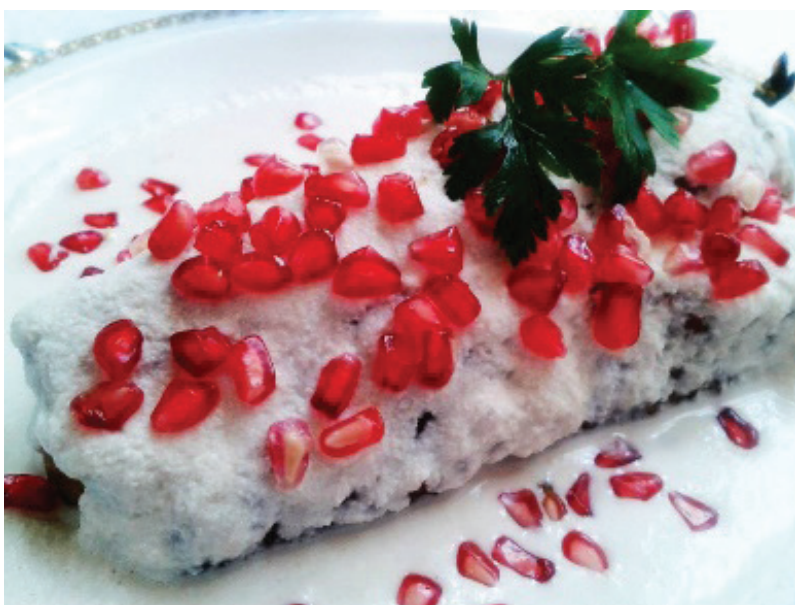
Chiles en nogada. Autor: David Sánchez Sánchez (2022).

Es aquí donde parece que se fusionan los diversos componentes de una tradición histórica y cultural que llega con excelencia hasta nuestra actualidad. En ese año 1821, con el Ejército Trigarante en Puebla desde el 27 de agosto, ya seguramente con banderas trigarantes y coincidiendo con la festividad de San Agustín (28 de agosto), fiesta del Santo fundador de la Orden de las Recoletas de San Agustín y onomástica del propio Agustín de Iturbide. Las religiosas del Convento de Nuestra Madre Santa Mónica de la Orden de Recoletas de San Agustín pudieron haber realizado ese y otros platos para