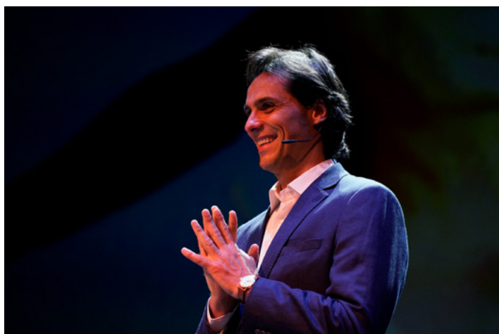
Igor Yebra, Bailarín y coreógrafo