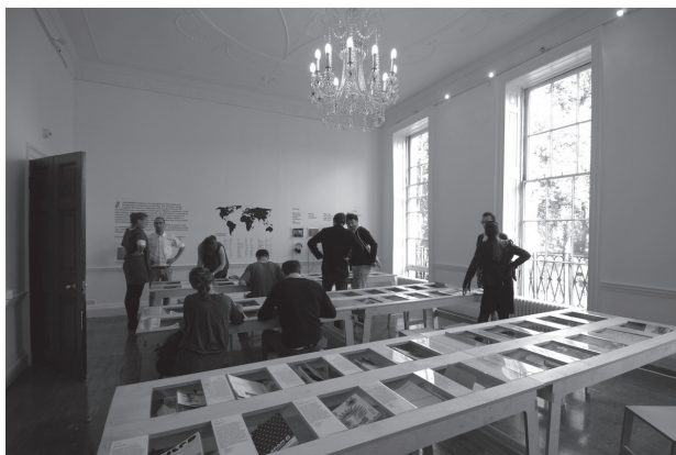
1 SECUENCIAS DE LA INAUGURACIÓN DE ARCHIZINES