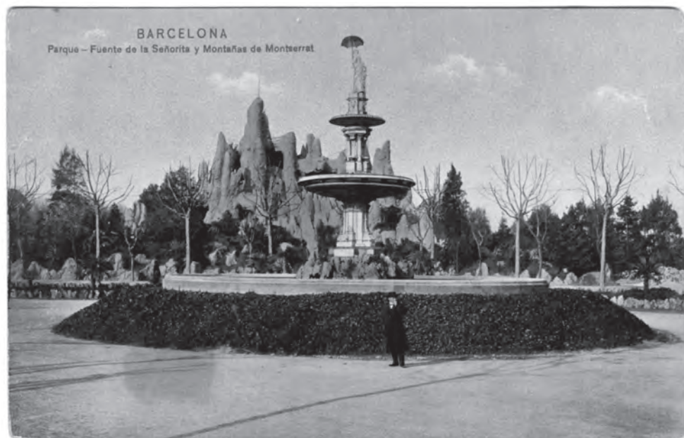
5 EL MONTSERRAT ARTIFICIAL DEL PARQUE DE LA CIUDADELA DE BARCELONA EN UNA TARJETA POSTAL, 1895..

Pero la construcción del Montserrat moderno también nos muestra cómo individuos y grupos inventan o reinventan el patrimonio y la arquitectura a través de la interpretación creativa del pasado. O, lo que es lo mismo, cómo el patrimonio siempre se vincula a las necesidades del presente a través de un proceso creativo que lo actualiza y lo rehace, a menudo no sólo simbólicamente, sino también materialmente. Así, Montserrat evidencia claramente cómo la autenticidad patrimonial no reside en la autenticidad material del objeto concreto, sino en su complejo proceso de definición. Y, de esta manera, también nos ayuda a cuestionar la enorme obsesión contemporánea por la preservación material del patrimonio. Mostrándonos así que, cómo afirma George Steiner, el futuro de Europa, asfixiada por el peso de la memoria y de la historia preservada, pasa por la necesaria conversión de " les lieux de mémoire " en " les lieux de la possibilité "; es decir, por su conversión en auténticas cajas de resonancia del presente. Montserrat nos ofrece un observatorio privilegiado desde el que reflexionar cómo alcanzar este reto. Y, al mismo tiempo, también nos muestra algunos de sus peligros.