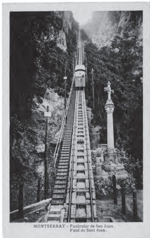
3 TARJETA POSTAL DEL FUNICULAR DE SANT JOAN. (COLECCIÓN GF).

Y finalmente, en el último grupo de capítulos se trata el intento de definir un nuevo proyecto general para Montserrat posterior a la Guerra. Una vez acabado el conflicto bélico, el proyecto de Puig no pudo retomarse debido a las evidentes resonancias catalanistas del proyecto, pero también a las de su arquitecto –Puig i Cadafalch. De manera que en el nuevo contexto de la dictadura, se encargó a Francesc Folguera un nuevo proyecto general. La solución esbozada por el nuevo arquitecto, que jamás llegó a definirse completamente debido a las circunstancias políticas y sociales, proponía un modelo de arquitectura que tomaba elementos prestados de la antigua arquitectura romana, a la vez que de los nuevos modelos alemanes e italianos, en un intento de definir una arquitectura con doble significado: que pudiese ser vista con buenos ojos