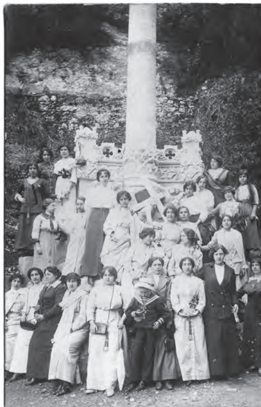
4 TARJETA POSTAL DEL VIA CRUCIS. (COLECCIÓN GF).